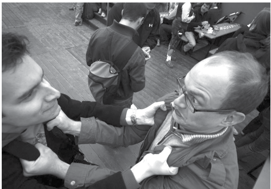
Пьяным людям море по колено. Они, как ураган, могут снести все на своем пути, оставив при этом немало жертв.

В июне, в селе Каменноозерском, произошел, можно сказать, семейный конфликт, который привел к несчастливому концу. Гражданин В., узнав от «доброжелателя» о том, что его бывшая сожительница находится в гостях не одна, захотел разобраться в ситуации. Воору-