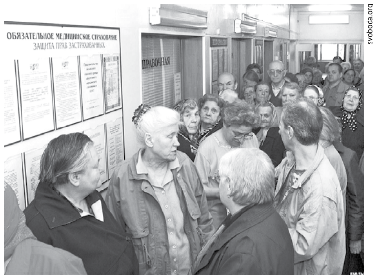
Время, указанное в талоне, зачастую не соответствует движению очереди. Поэтому пациенты вынуждены подолгу просиживать у кабинетов.