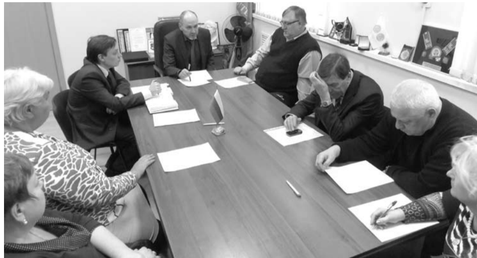
Заседание политсовета прошло плодотворно, были обсуждены разные вопросы, в том числе одобрен проект бюджета ГО Богданович.