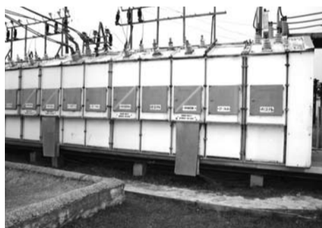
Обновленные ячейки подстанции «Тыгиш».

В октябре этого года была завершена реконструкция подстанции 110/10 киловольт (кВ) «Тыгиш», которая, несмотря на название, территориально расположена в Богдановиче. Реконструкция энергообъекта прошла в два этапа. Первый этап модернизации был закончен в 2012 году. На открытом распределительном устройстве 110 киловольт подстанции тогда были установлены современные элегазовые выключатели, заменившие устаревшие блоки отделителей и короткозамкатель 110 кВ. Согласно программе второго этапа модернизации, прошедшего в этом году, работы произведены в комплектном распределительном устройстве (КРУ) 10 киловольт подстанции. Вместо 14 масляных выключателей 10 киловольт установлены их вакуумные аналоги, более экологичные и пожаробезопасные. Выполнена