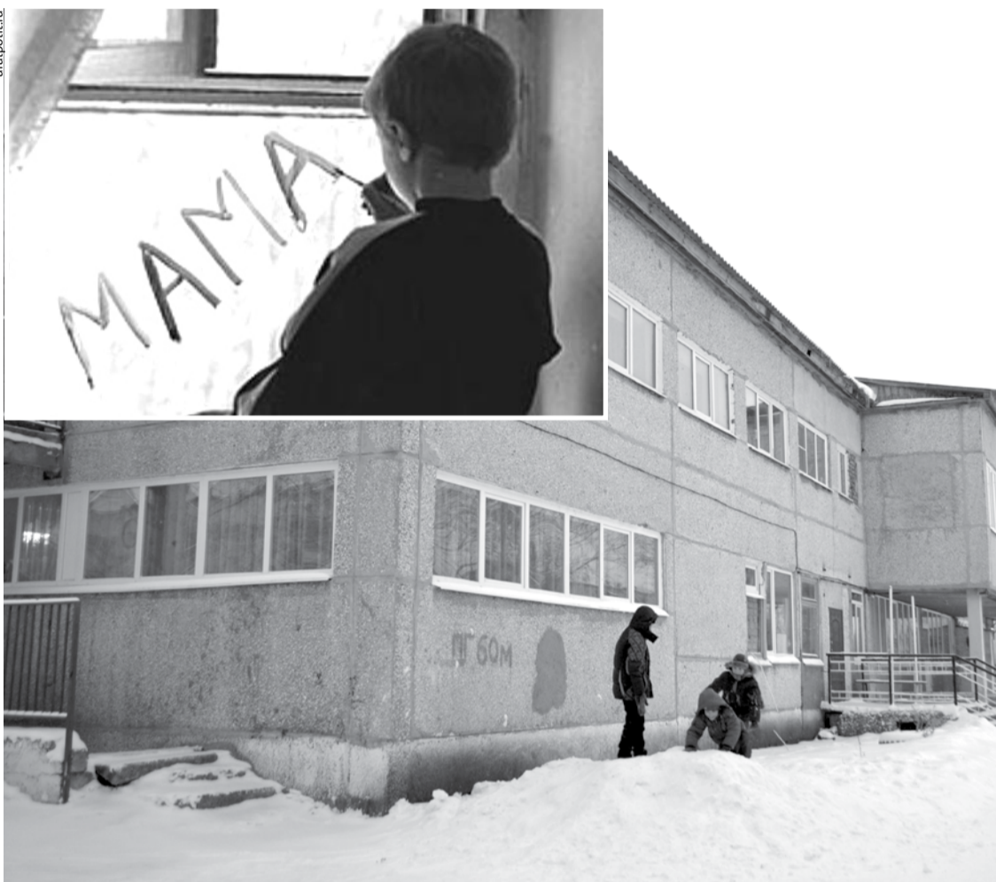
Сироты и дети, оставшиеся без попечения родителей, как и домашние дети, все очень разные. Но из-за отсутствия родительского тепла на их долю выпадает больше испытаний.