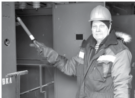
У ЭНЕРГЕТИКОВ – ПРАЗДНИК