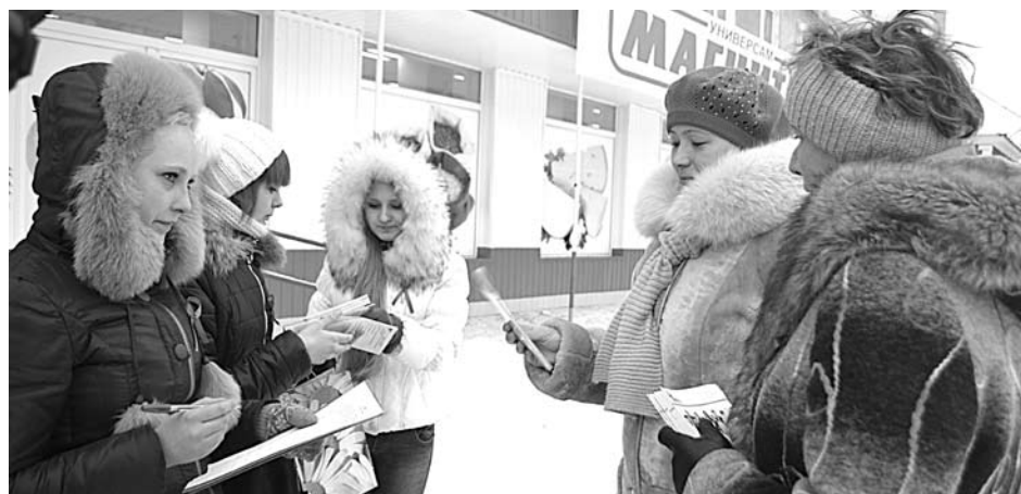
Учащиеся БПТ привлекли внимание богдановичцев к проблеме ВИЧ. Профилактика данного заболевания важна для всех.

Всегда кажется, что проблема нас обойдет. Но на самом деле она рядом. Статистика не утешительна. Свердловская область занимает одно из лидирующих мест в России по зарегистрированным случаям ВИЧ-инфекции. Поэтому проведение этой акции – важное звено в профилактической работе, проводимой в нашем округе.