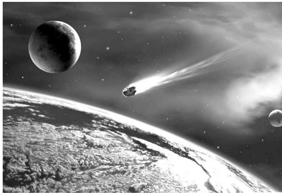
Космическая атака Богданович не задела.