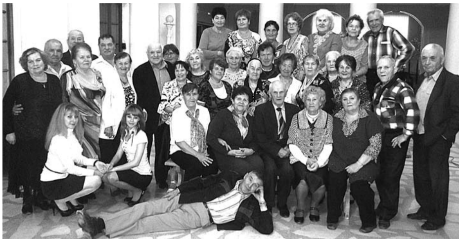
Клубу «Валентина» – 15 лет. И это далеко не последний юбилей, который представители клуба отметят своим дружным и неунывающим коллективом.