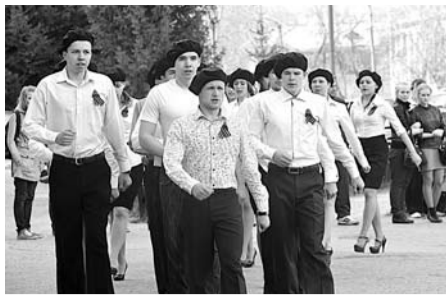
МОЛОДЕЖЬ ЖЕЛАЕТ ЖИТЬ В РОССИИ