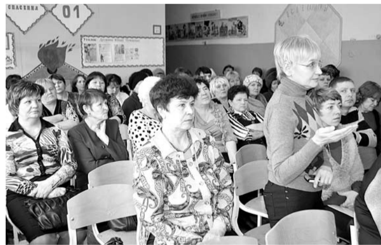
На отчетном собрании в селе Кунарском в адрес представителей администрации поступило много вопросов. На все вопросы сельчане получили ответы.