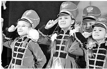
ГОРОД ПОЗДРАВИЛ МУЖЧИН