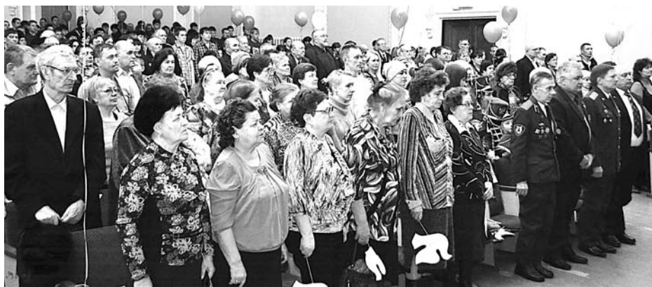
На праздничном концерте вспомнили тех, кто погиб, защищая Родину. Их память почтили минутой молчания.

Концерт подарил зрителям немало радостных минут.