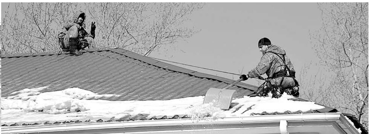
Работники ООО «Управдом» приближали весну, скидывая снег с крыш многоэтажных домов на ул. Гагарина.