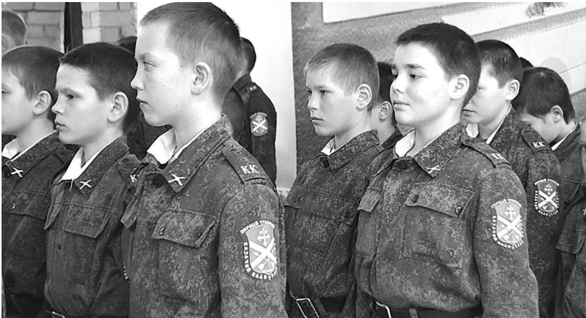
Многие из кадетов Первого Уральского кадетского (казачьего) корпуса - будущие воины, которые наверняка станут достойными защитниками Отечества.