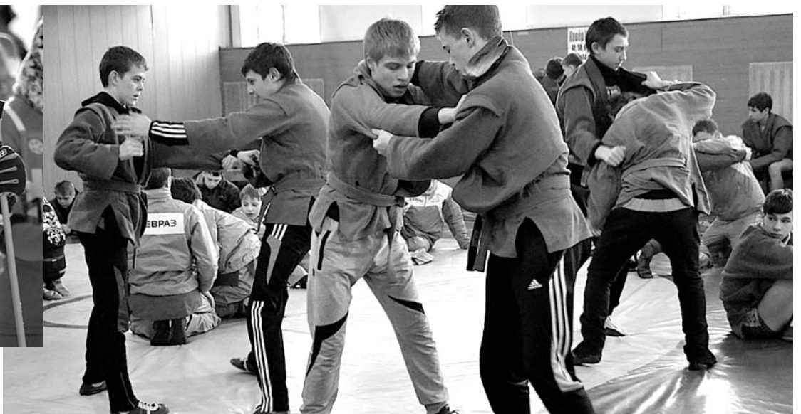
...и чемпионат по борьбе самбо на призы главы нашего ГО.