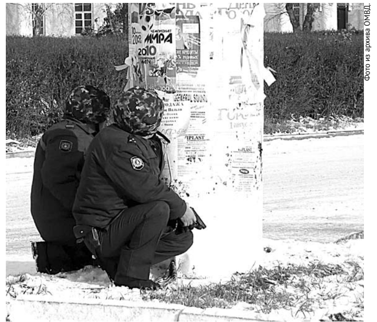
Стражи порядка регулярно проводят учения, в ходе которых отрабатываются действия при ЧС.