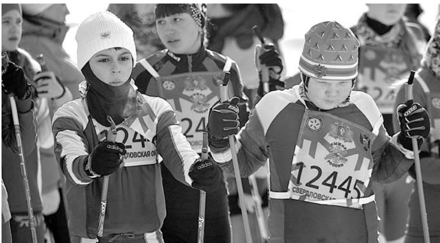
Февраль был насыщен спортивными мероприятиями, и одними из главных стали «Лыжня России - 2013»...