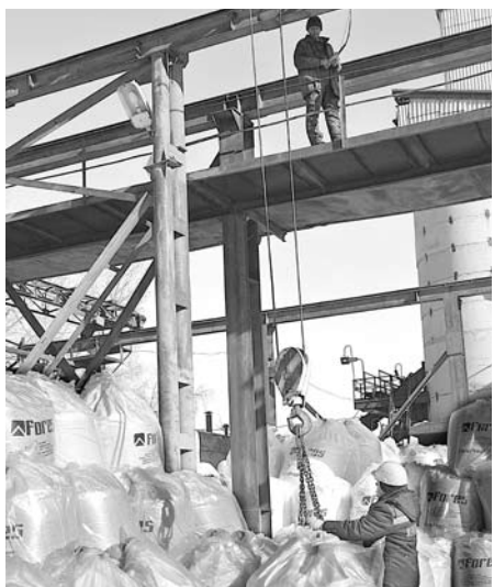
Производится погрузка продукции завода в вагоны.