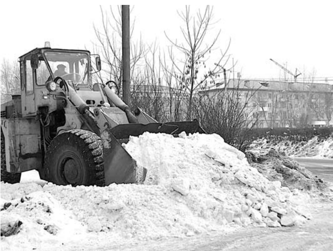
Весь февраль шла упорная борьба со снегом.