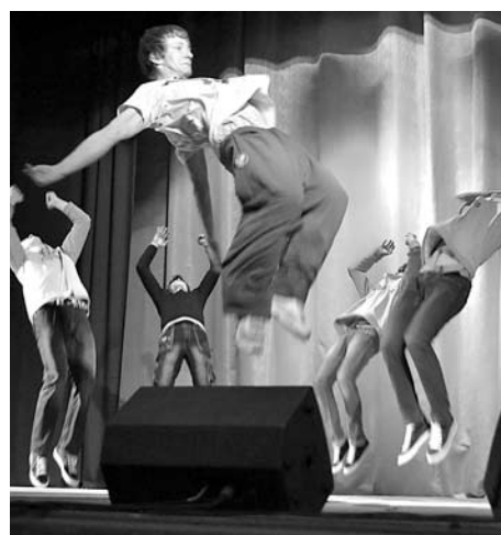
Молодежь веселилась и реально летала на сцене.

Шоу закончилось так же ярко. На улице был запущен фейерверк.