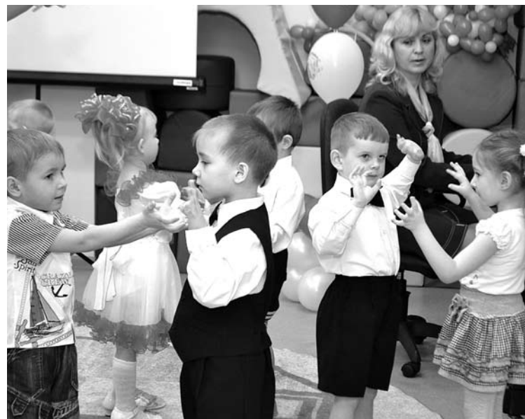
В «Детском саду Будущего» №1 теперь еще громче звучит смех малышей, так как число детей выросло на одну группу.

Со строительством нового детского сада указ президента мы выполним даже не в 2016 году, а намного раньше.