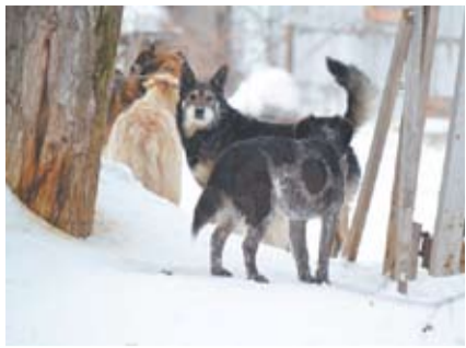
ВНИМАНИЕ! НАЧАЛСЯ ОТЛОВ СОБАК