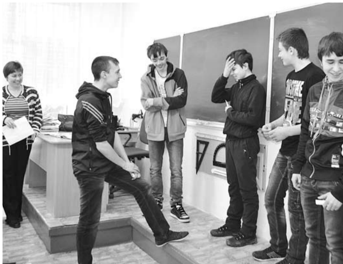
Старшеклассники школы №3 с удовольствием приняли участие в профорientационных играх.