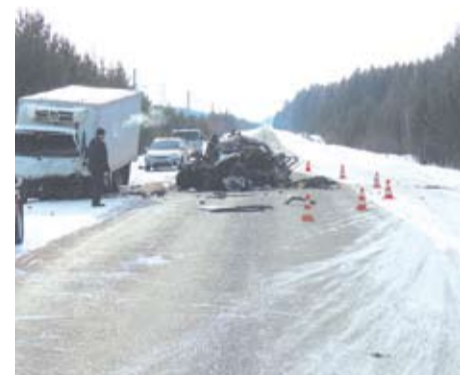
В результате столкновения с грузовой иномаркой два человека погибли, а от «Волги» осталась гора металла.