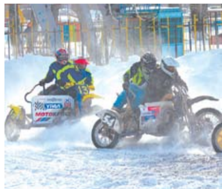
Гонщики боролись за победу до последнего.