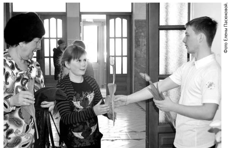
Дарить цветы женщинам на 8 Марта — традиция многолетняя. Мужского внимания заслуживают представительницы прекрасного пола всех возрастов.

редовались видеороликами, в которых представители сильной половины нашего городского округа поздравляли женщин с этим теплым весенним праздником.