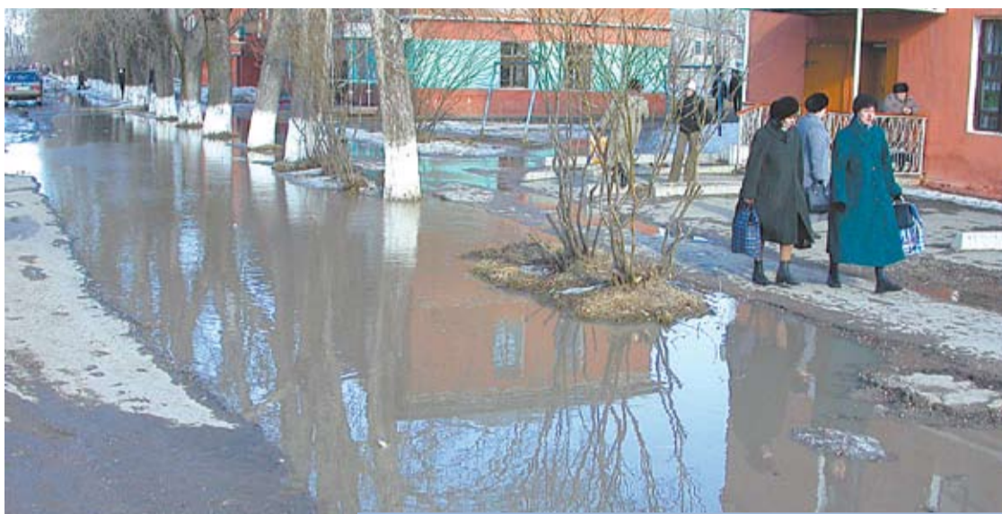
В этом году зима выдалась снежной. Весеннее солнце растопит снег, и на улицах появятся лужи. Коммунальные службы уже сейчас готовятся устранять эту проблему.

Еще один вопрос, который волнует богдановичцев в период весеннего половодья – это обильное таяние снега в населенных пунктах . Согласно все тому же постановлению №311 МУП «Благоустройство» и управления сельских территорий в марте должны провести расчистку систем ливневых канализаций в городе и селах с целью пропуска сточных вод, установить наблюдение за таянием снега и при необходимости организовать расчистку дорог, проездов и подъездов к зданиям, сооружениям .