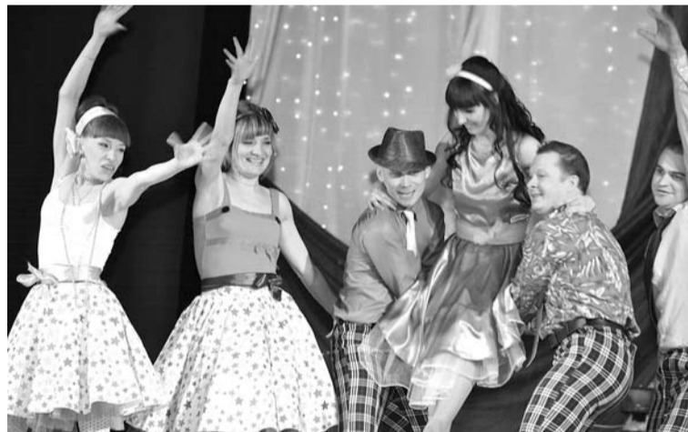
«А у нас во дворе есть девчонка одна...» — эта строчка из известной песни послужила названием I этапа конкурса. Объединенная команда заводоуправления и автогаража выступила с задором.