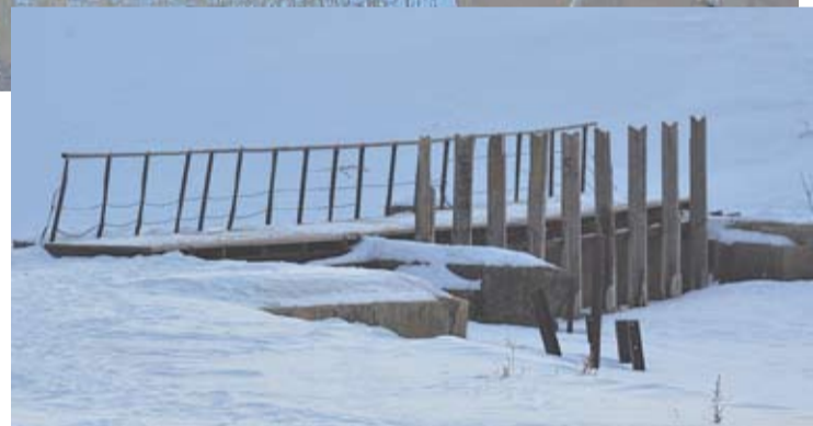
Плотина – сооружение, созданное для защиты от паводков. Пока Глуховская плотина утопает в снегу. Но даже растаявший снег не должен вызвать затопления – наш городской округ считается паводкобезопасным.