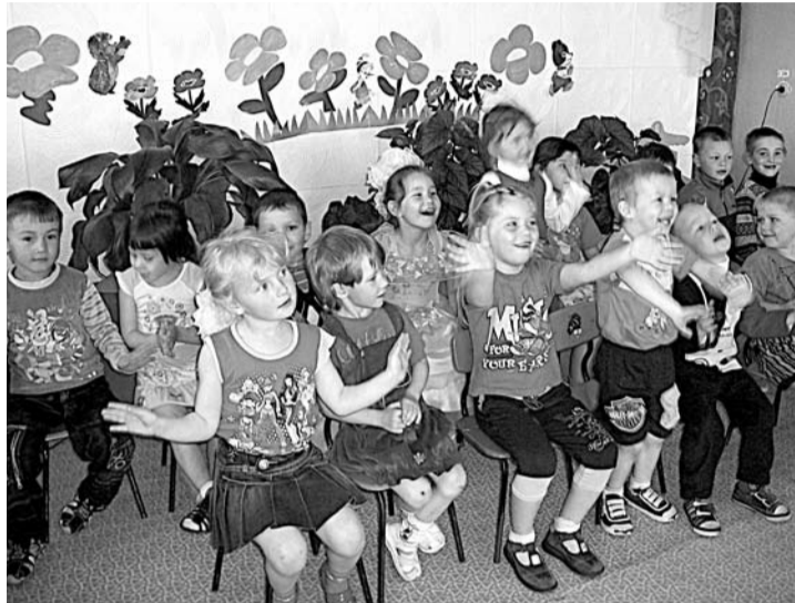
В Гарашкинском детском саду дети с пользой и интересом проводят время.

Трудно представить жизнь садика без взаимодействия с обществом. Можно сказать, в этом отношении нам повезло: и жители села, и родители наших воспитанников принимают активное участие в оформлении территории и помещений садика. В этом году при участии наших родителей