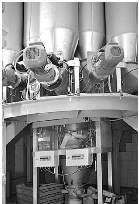
Движение сырьевых потоков направлено сверху вниз. На фото представлен модуль затаривания сырья.