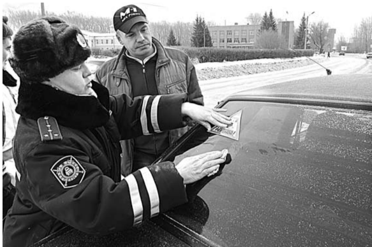
Яркие наклейки «В автомобиле ребенок» привлекают к себе внимание.

У ИНСПЕКТОРОВ ГИБДД серьезную озабоченность вызывает легкомысленное отношение родителей к обеспечению безопасности детей при перевозке в личном транспорте. Уже с начала этого года на территории нашего городского округа в результате ДТП пострадало два ребёнка, один из них погиб.