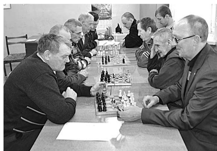
Соперники шахматного турнира редко соглашаются на ничью. Одна партия в шахматы может длиться часами.