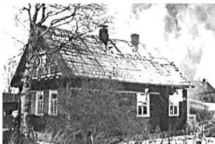
ПОЖАРНЫЙ СПАС ЖЕНЩИНУ ИЗ ОГНЯ