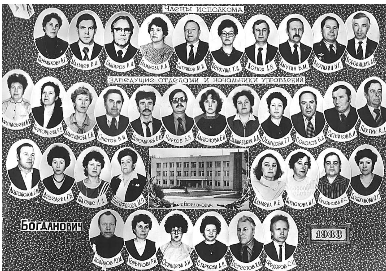
Аппарат исполкома городского Совета народных депутатов 20 созыва. Фото 1988 года.

За помощью мы обратились в краеведческий музей. Из множества предоставленных фотографий выбрали самые интересные. Публикуем одну из них.