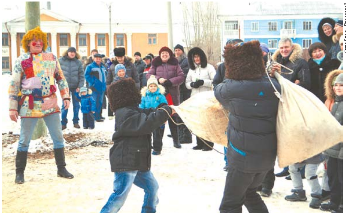
Бои с мешками выявляли не только сильных, но и ловких.