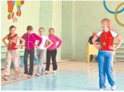
ФИЗКУЛЬТУРА ПО НОВЫМ ПРАВИЛАМ