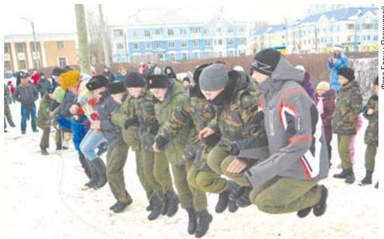
На площадке Первого Уральского кадетского (казачьего) корпуса желающие могли показать свою молодецкую удаль.