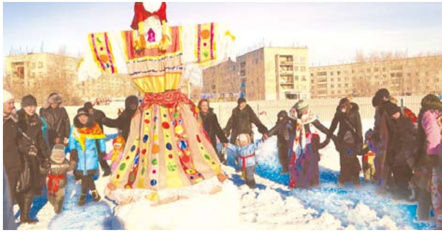
Воспитанники детского сада №38 «Детский сад Будущего», родители, гости, припевая и приплясывая, водили хоровод вокруг чучела Зимы.

В детском саду № 38 «Детский сад Будущего» Масленица прошла с размахом. Работниками детского сада был организован театрализованно-игровой праздник по русским тра-