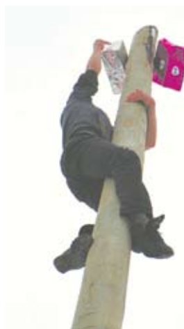
Забраться на столб удалось лишь трем смельчакам.