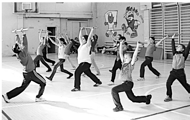
Со следующего учебного года в преподавании физкультуры в 5-9 классах произойдут изменения.

- Безусловно, изменения коснутся и физической культуры. По новым стандартам в целом меняется отношение к учащемуся. Если раньше часто учитель строил отношения с учеником на основе авторитаризма, то теперь мы должны строить субъект-субъектные отношения,