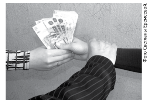
Однажды почувствовав легкие деньги, преступник впоследствии никогда не откажется от них.

Одно из дел возбуждено за попытку дать взятку инспектору ГИБДД. Уже состоялся суд, виновный должен заплатить штраф в размере 30 тысяч рублей (тридцатикратный размер взятки). Пять уголовных дел возбуждено в отношении работников ветеринарной станции. Были выявлены факты хищения денежных средств за оказанные услуги, а также нарушения по оформлению ве-