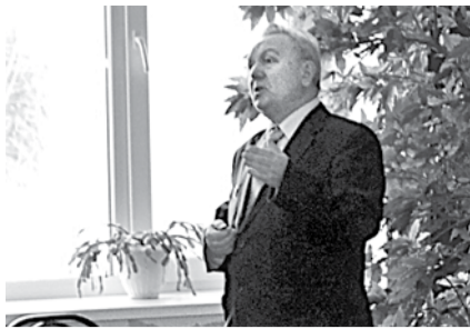
БОГДАНОВИЧ НЕБЛАГОПОЛУЧЕН ПО ТУБЕРКУЛЕЗУ