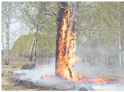
ГОТОВИМСЯ К ПОЖАРООПАСНОМУ ПЕРИОДУ