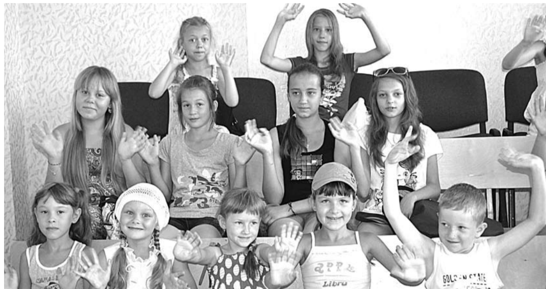
За время летнего отдыха в лагере ребята проживают целую жизнь: участвуют в разных играх, забавах, конкурсах, эстафетах, общаются с ровесниками, в общем, получают массу положительных эмоций.

ходы и экскурсии. Для этого руководители патриотических объединений, организованных групп ребят также должны подать свои заявки в управление образования.