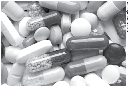
ЧЕМ ОПАСНО САМОЛЕЧЕНИЕ