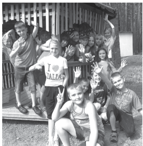
Грамотно организованный отдых поможет детям набраться сил и бодрости для успешной учебы в следующем году.