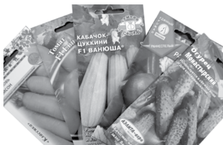
КАКОВЫ СЕМЕНА - ТАКОВ И РЕЗУЛЬТАТ