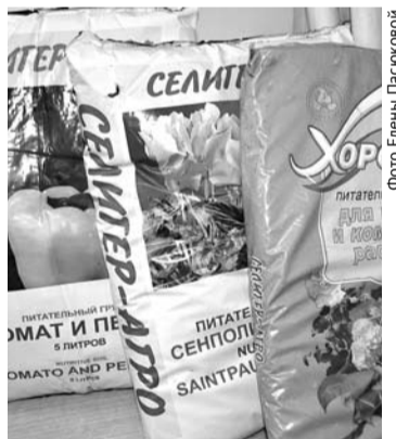
Грунт нужно подготовить правильно, тогда и рассада вырастет здоровой.

купить 3-4 разных грунта, перед посевом тщательно перемешать их и уже в такую смесь сеять семена. Очень хороший грунт получается из смеси покупного и собственноручно приготовленного грунта. Если вы собираетесь сеять семена земляники или цветов, то покупайте грунт бедный питательными веществами, без избытка удобрений. Отечественные производители грунтов практически все грешат непостоянством, и полагаться только на одну марку не стоит. Анализ показывает, что наиболее оптимальны для садоводов следующие почвосмеси : «Живая земля», «Агрикола», «Нестеровский», «Микропарник», а также грунты «Крепыш», «Огородник», «Малышок».