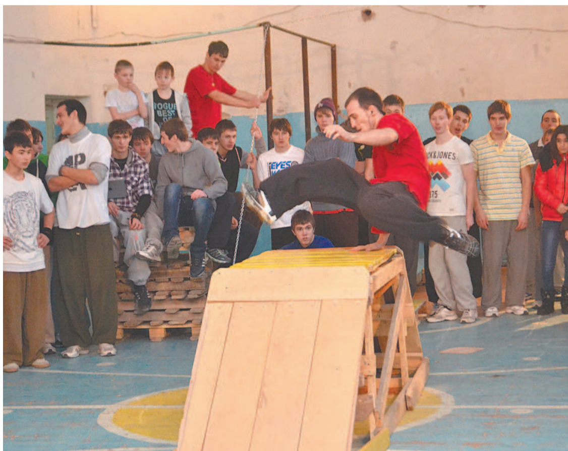
Паркур – это движение и преодоление препятствий. Для трейсеров непреодолимых препятствий практически не существует.