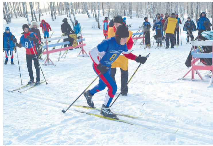
Спортсмены выходили на старт с боевым настроем и сохраняли хорошее настроение и после финиша.