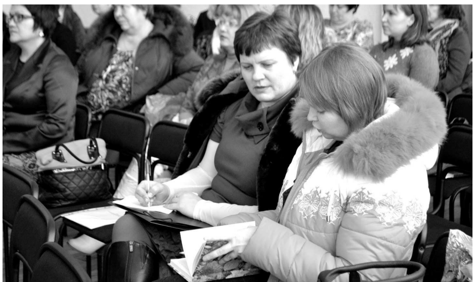
Педагоги делились опытом и представляли результаты своей работы.

Каждая экспериментальная площадка представляла свои наработки и достижения, свою образовательную среду, за этим, в конечном итоге, стоит судьба наших детей.