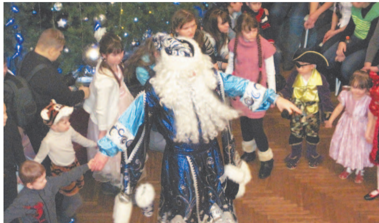
На новогоднем празднике в театре музыкальной комедии дети нашего района веселились вокруг елки вместе с Дедом Морозом и Снегурочкой.

29 декабря пять школьных автобусов с детьми из разных образовательных учреждений района поехали в Екатеринбург. Праздник в этом году проходил в театре музыкальной комедии. С новогодними поздравлениями детей встречали Дед Мороз и Снегурочка, не