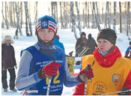
ЛЫЖНИКИ ОБЛАСТИ СОСТЯЗАЛИСЬ В «БЕРЕЗКЕ» Стр. 12.