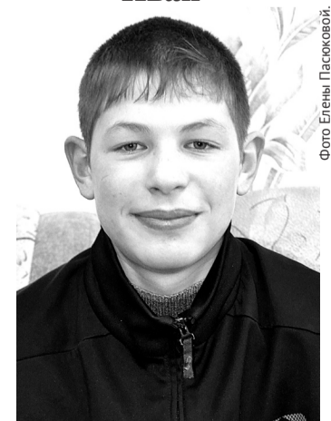
Иван любит труд, хороший помощник, не терпит несправедливости.