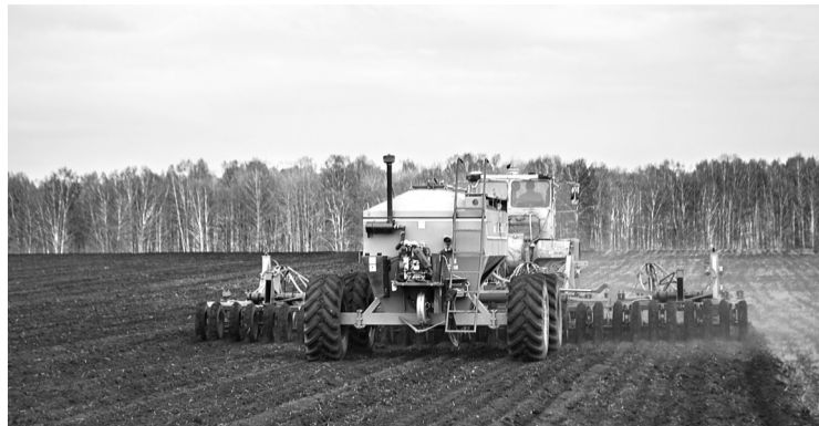
На севе основных земельных площадей ООО «БМК» были задействованы посевные комплексы «Кузбасс». На снимке идет сев ячменя.