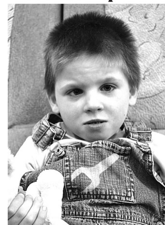
Виктор научился говорить, играть, общаться со сверстниками.