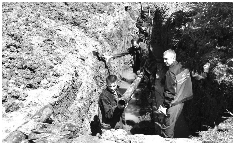
С 17 мая, через два дня после окончания отопительного сезона, начались опрессовочные работы с целью выявления ветхих участков тепловых сетей. На фото: работники МУП «БТС» занимаются заменой труб на одном из выявленных участков – Мира, 2 .

Объединение сетей и котельных не обошлось без определенных проблем. Уже после начала отопительного сезона нам была передана котельная Байнов . В связи с тем, что подготовительные работы на ней не были проведены, она доставила нашему коллективу немало хлопот в зимний период. Аварийные остановки котлов и тепловых сетей вызвали массу