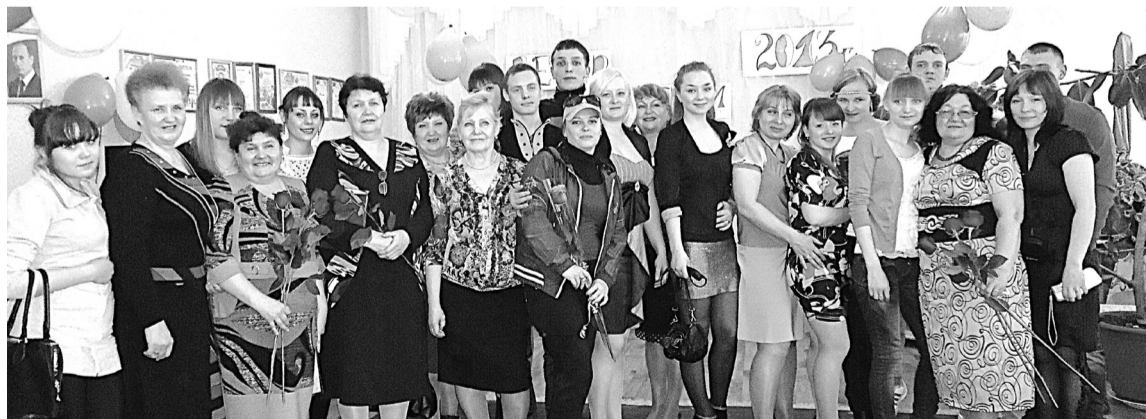
Приятные воспоминания наполнили вечер в детском доме, посвященный встрече выпускников.