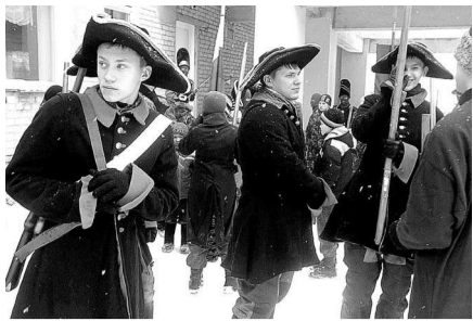
ИЛЬИНСКИЙ «СОКОЛ» УЧАСТВОВАЛ В ИСТОРИЧЕСКОЙ БИТВЕ