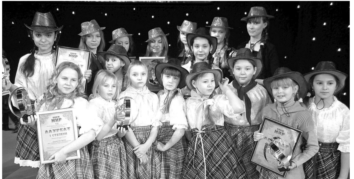
Есть такое выражение: «Главное - не победа, а участие», но когда участие приносит победу - это вдвойне приятно.