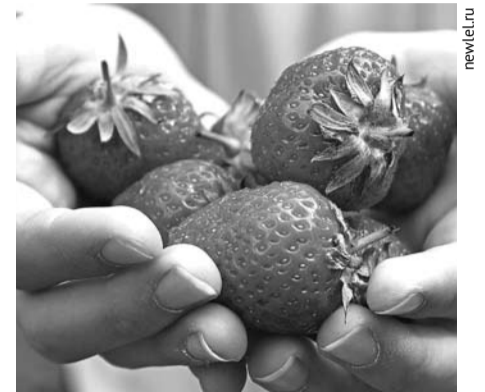
Земляника - любимое лакомство взрослых и детей.

Сразу после сбора урожая убирают засохшие и больные листья, удаляют усы и розетки, перекапывают между-