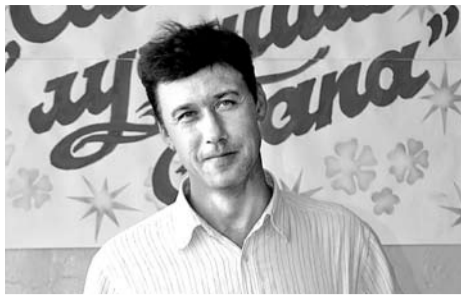
ВЫБРАН ЛУЧШИЙ ПАПА РАЙОНА