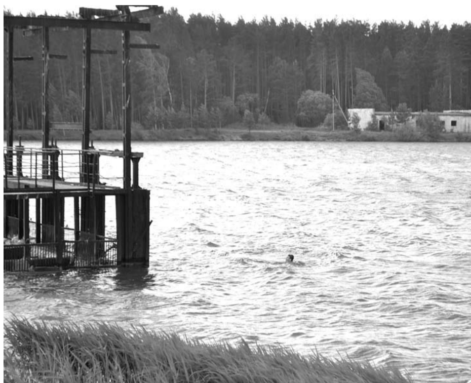
Паршинский пруд: красивое место, чистая вода, возможность порыбачить – все, что нужно для хорошего отдыха.

- Существуют правила любительского спортивного рыболовства, которые действуют и на территории нашего рыбопромыслового участка. Согласно им запрещено использование при рыбалке сетей, электроудочек, горпунгов и других средств ловли. Плавсредства и различные прикормки сегодня можно использовать с некоторыми ограничениями, все по тем же правилам. Отмечу, что своих запретов мы не устанавливаем, на Паршинском пруду действуют точно такие же правила рыболовства, как и на всей территории нашей страны.