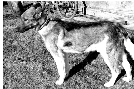
Титан послушно гуляет на поводке, после прогулки сам заходит в вольер.

Комитет по управлению муниципальным имуществом городского округа Богданович информирует о результатах продажи муниципального имущества.