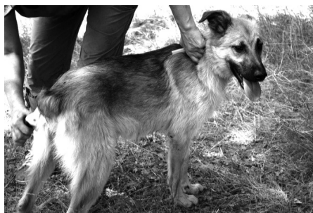
Если в семье есть дети, Варя – самый лучший вариант домашнего любимца.