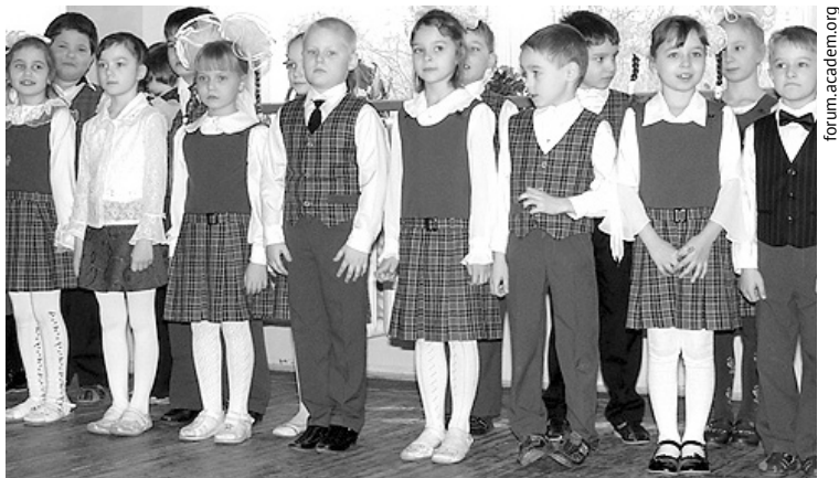
Введение формы создаст деловую обстановку в школе, будет способствовать дисциплине и сгладит имущественные и социальные различия среди учащихся.

- В начальной школе мы ввели школьную форму уже около четырёх лет назад. Ребятам и родителям очень нравится. Для введения формы в старших классах вся необходимая