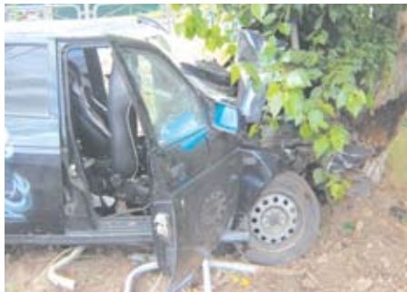
Вот так выглядела машина после аварии на ул. Кунавина.

29 июня на 5 км автодороги г. Богданович-с. Покровское водитель автомашины «ВАЗ-2114» вместе с детьми отправилась из г. Каменска-Уральского в г. Асбест. При движении она не справилась с управлением, допустила занос автомобиля с последующим опрокидыванием. В результате ДТП пятилетний ребенок, находившийся в детском удерживающем устройстве, получил сотрясение головного мозга, ушиб височной части головы. Со слов мамы, которая и находилась за рулем, выяснилось,