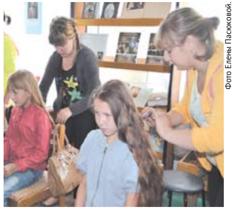
Плести косы – наука сложная, зато прическа получается красивой и необычной.

Здесь проходил мастер-класс «Коса - девичья краса». Юные парикмахеры рассказали девочкам, что разновидностей кос много и создание каждой прически занимает время.