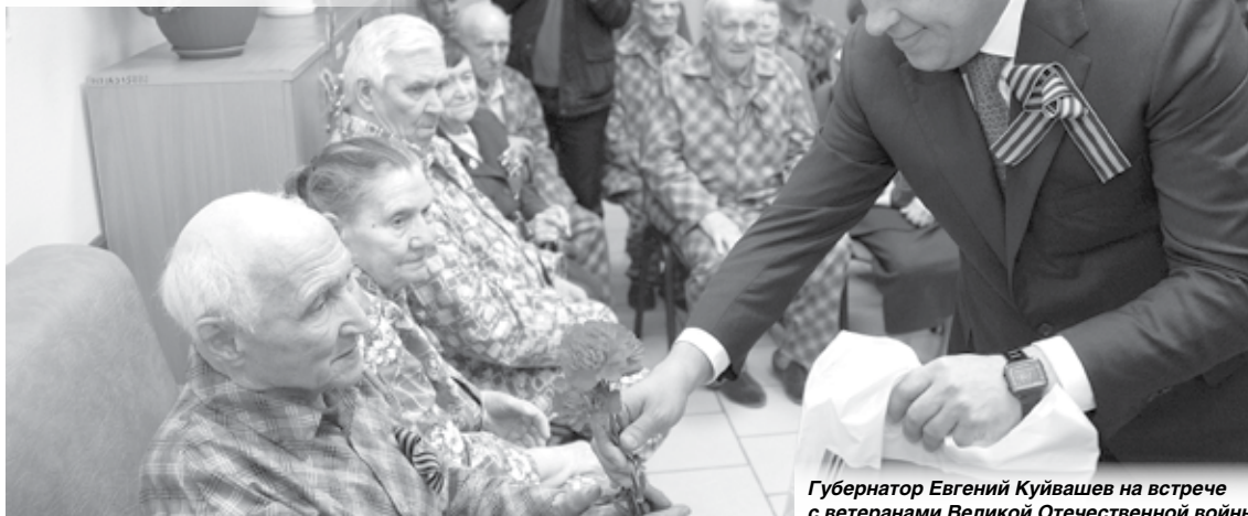
Губернатор Евгений Куйвашев на встрече с ветеранами Великой Отечественной войны

Губернатор Евгений Куйвашев подписал 29 июля указ о проведении Дня пенсионера в Свердловской области.