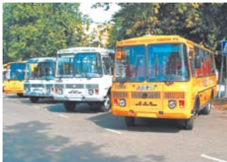
В ДЕНЬ ГОРОДА ИЗМЕНИТСЯ РАСПИСАНИЕ АВТОБУСОВ Стр. 2.