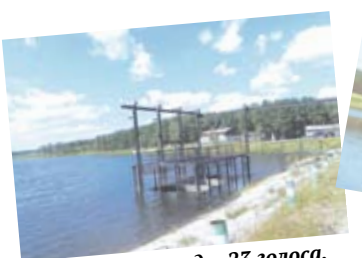
Паршинский пруд - 23 голоса.