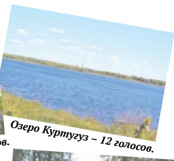
Озеро Куртугуз - 12 голосов.