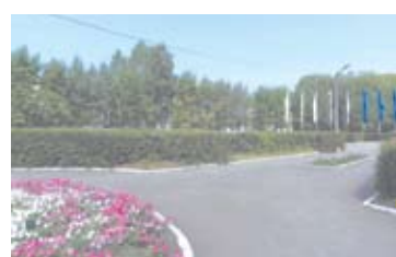
Площадь Мира - 11 голосов.