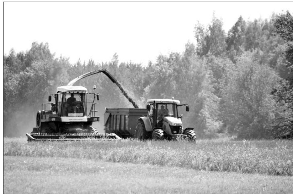
Всего в ГО Богданович в обработке находится 39 тысяч гектаров пашни.

- Пациент получает медицинскую услугу либо за счет собственных средств, либо за счет средств фонда обязательного медицинского страхования. Поэтому, если вы оплачиваете медицинскую услугу, лечебное учреждение не вправе требовать от вас полис . Более того, предоставление полиса приведет к тому, что больнице данная медицинская услуга будет оплачена дважды: пациентом и страховой компанией.