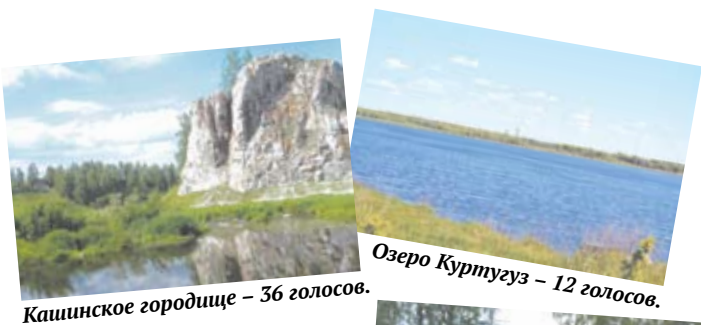
Кашиинское городище - 36 голосов.

В течение июля на сайте «НС» ( www.narslovo.ru ) редакция проводила опрос, в ходе которого просила богдановичцев назвать самый красивый уголок нашей малой родины. И вот какие результаты получились.