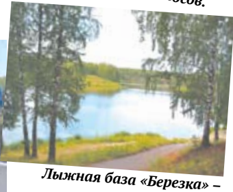
Лыжная база «Березка» - 4 голоса.