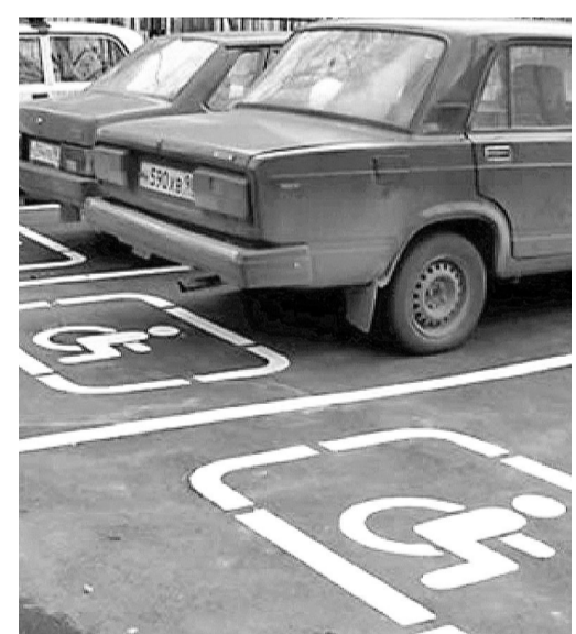
Сегодня инвалиды имеют возможность ездить на личном транспорте. У них есть право обучиться вождению бесплатно или с частичной оплатой этой социальной услуги.

Потенциальные курсанты должны обратиться в УСП по Богдановичскому району с заявлением . К нему необходимо приложить ряд документов, о которых можно узнать по телефону – 2-18-70.