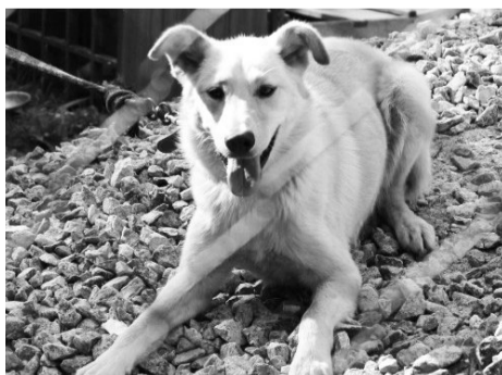
Лиська - и друг, и охотник.