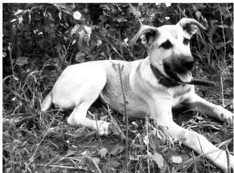
Отличный охранник дома.

Лиська - очень активная собака среднего роста, стерилизована, по-