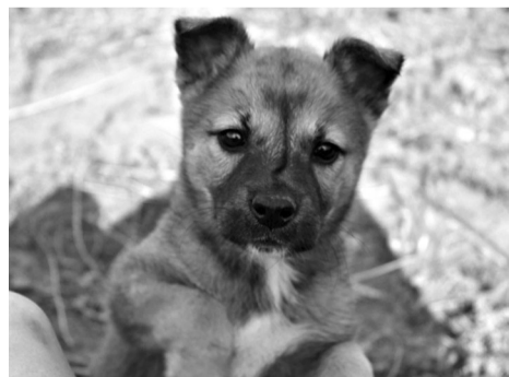
Кроха ждет хозяина.

Этого милого щенка выкинули, когда он ещё не мог даже есть самостоятельно. Сейчас «девочка» немного подросла, ест всё, очень любит общение с людьми. Вырастет некрупной, но будет хорошим «звоночком» даже в своём доме. Можно взять это чудо и в квартиру.