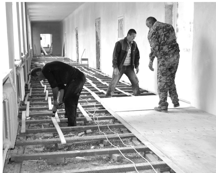
Ремонт в школе № 1 идет полным ходом. Замену полов ведут рабочие подрядной организации ООО «СК Армада».