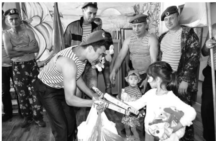
Мужественные десантники не забывают о детях. В день своего праздника «десантура приземлилась» в детском доме и вручила его воспитанникам подарки.

Продолжился праздник на базе отдыха «Кояш» (Прищаново), где десантники и спецназовцы провели соревнования по стрельбе из пневматической винтовки, армрестлингу, разборке автомата, футболу и перетягиванию каната.