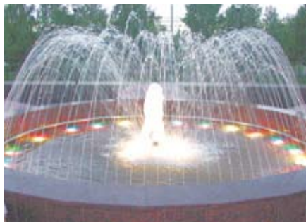
БЫТЬ ЛИ ФОНТАНУ В БОГДАНОВИЧЕ?