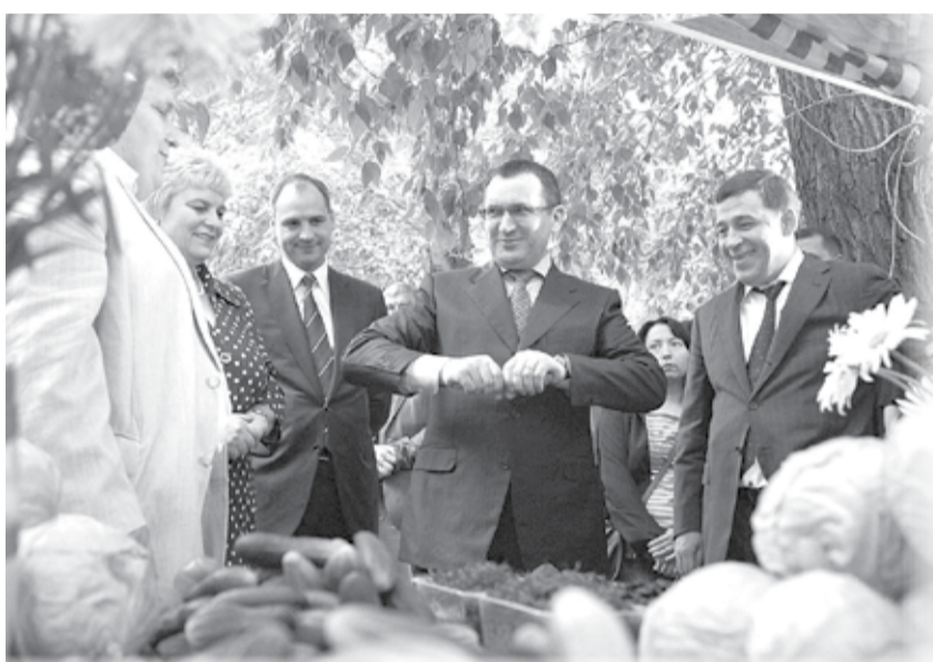
Губернатор Евгений Куйвашев и министр сельского хозяйства РФ Николай Фёдоров посетили Уральский аграрный университет в Екатеринбурге

Свердловская область может рассчитывать на федеральные субсидии для обновления парка сельхозтехники, которые будут выделены регионам в ближайшее время. Об этом заявил министр сельского хозяйства РФ Николай Фёдоров во время рабочей поездки на Средний Урал.