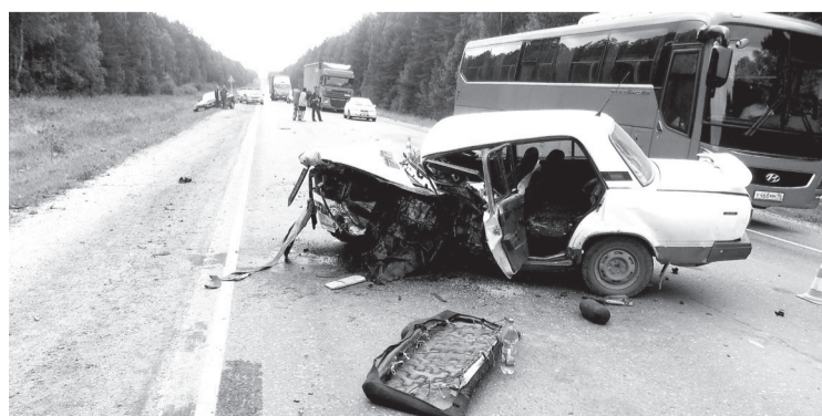
Часто аварии на дорогах приводят к печальным последствиям.

В черте города аварийными участками признаны самые перегруженные улицы - Кунавина и Партизанская (от Гагарина до Кунавина). Главной причиной совершённых здесь ДТП является несоблюдение водителями условий движения задним ходом.