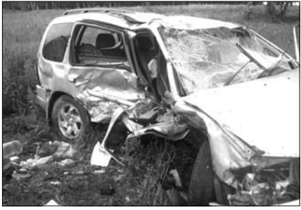
ТРАГЕДИИ НА ДОРОГЕ