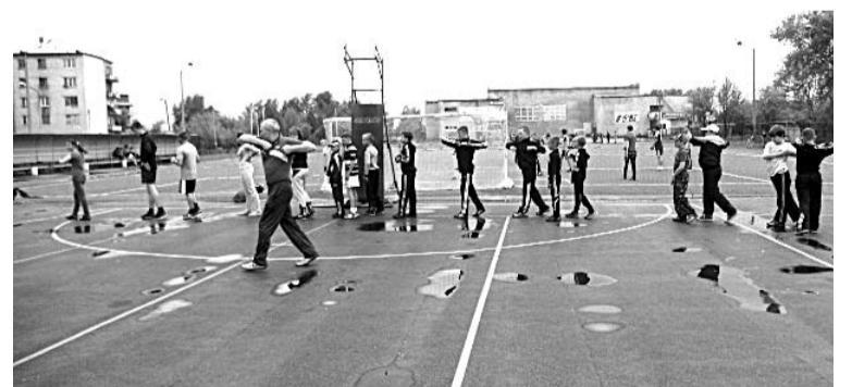
В спортивном лагере, организованном на базе СК «Колорит», каждое утро дети начинают с зарядки.

Всего за лето в спортивных лагерях отдохнуло около 632 юных спортсменов Богдановича. С новыми силами они приступят к учебе и пойдут навстречу очередным победам.