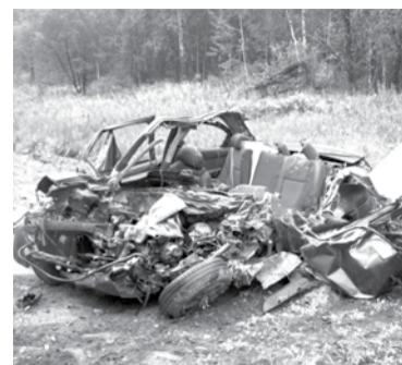
Груда железа – все, что осталось от автомобиля, в котором ехала молодая семья. В результате ДТП муж с женой погибли, их ребенок остался сиротой.

В воскресенье, 11 августа , на 80 км этой же автодороги произошло еще одно страшное ДТП. 24-летний