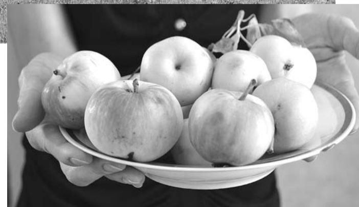
19 августа православная церковь отметила Преображение Господне – праздник, который в народе получил название Яблочный Спас. Пришла пора собирать сочные яблочки.