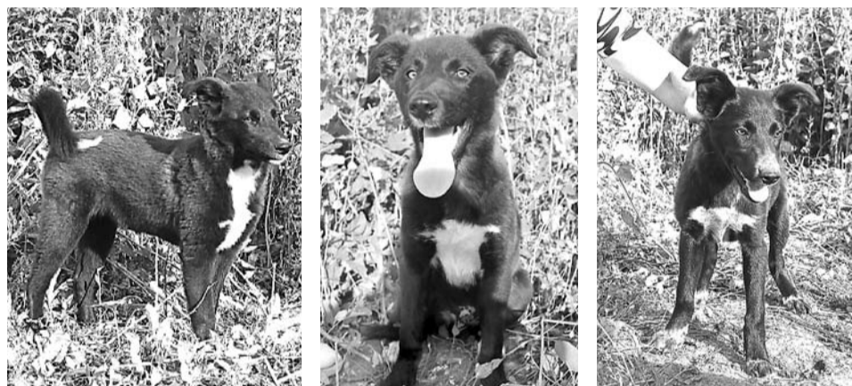
Три щенка – три мохнатых друга ждут новых хозяев.