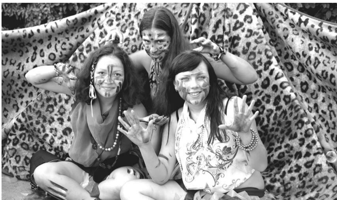
Август запомнился богдановичцам празднованием Дня города. Нынче в эти дни по Богдановичу гуляли жители разных стран. Барабинские девчонки привезли с собой культуру Африки.