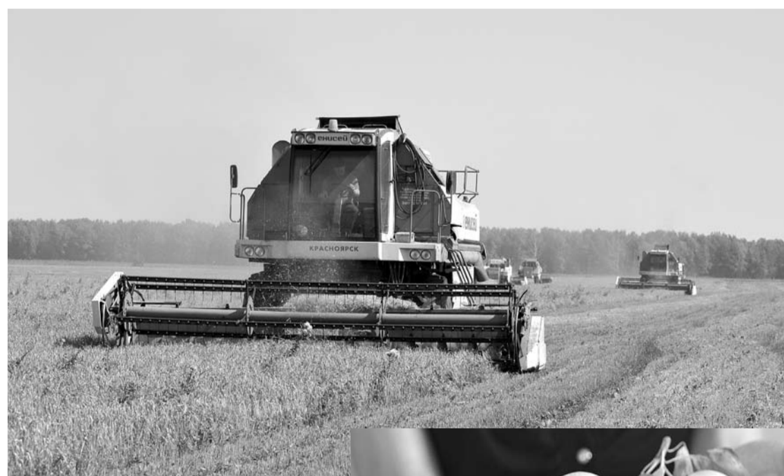
Август – пора уборки нового урожая. Сегодня уборочная на полях нашего округа идет полным ходом.