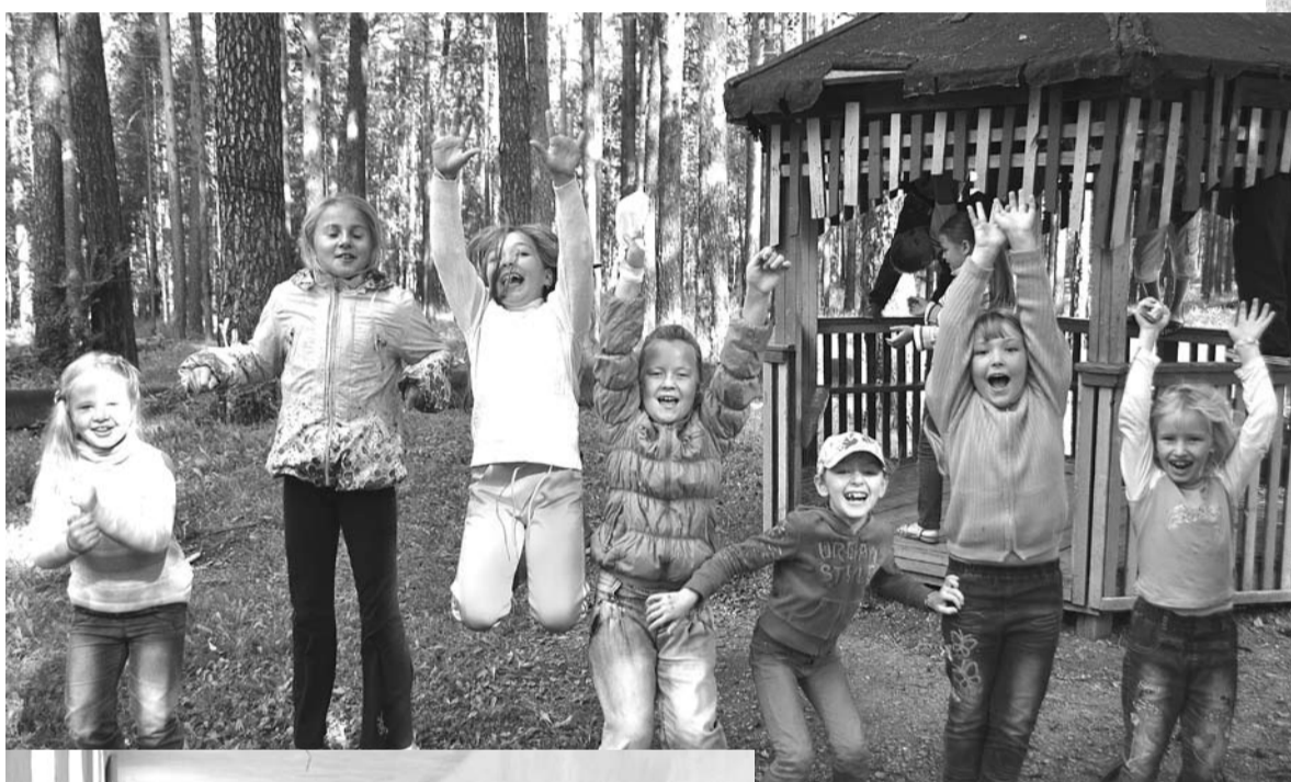
Последний месяц летних каникул – это еще одна возможность для школьников отдохнуть перед началом учебного года. Счастливые и здоровые, они приступят к учебе.