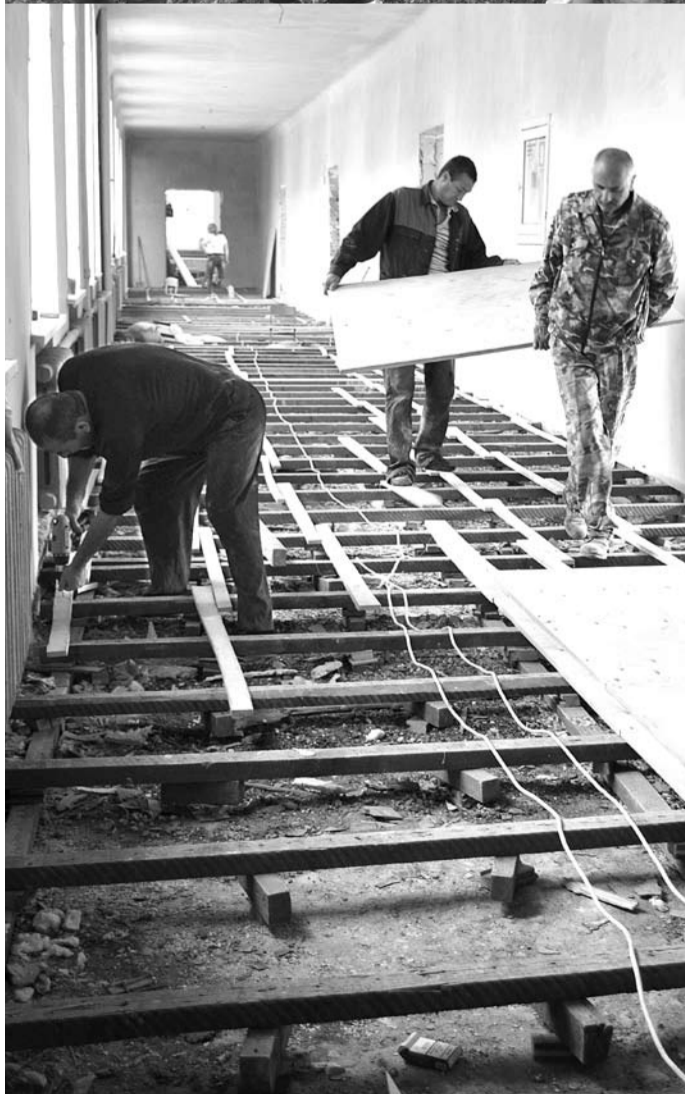
Ремонты в школах шли и в августе, но 1 сентября обновленные учебные заведения распахнут свои двери перед учениками.