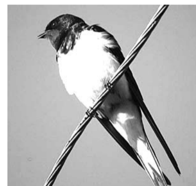
Ласточки прилетели к нам весной и всё лето провели в родных краях. Все знают, что, по приметам, эти птицы предупреждают о надвигающемся дожде.