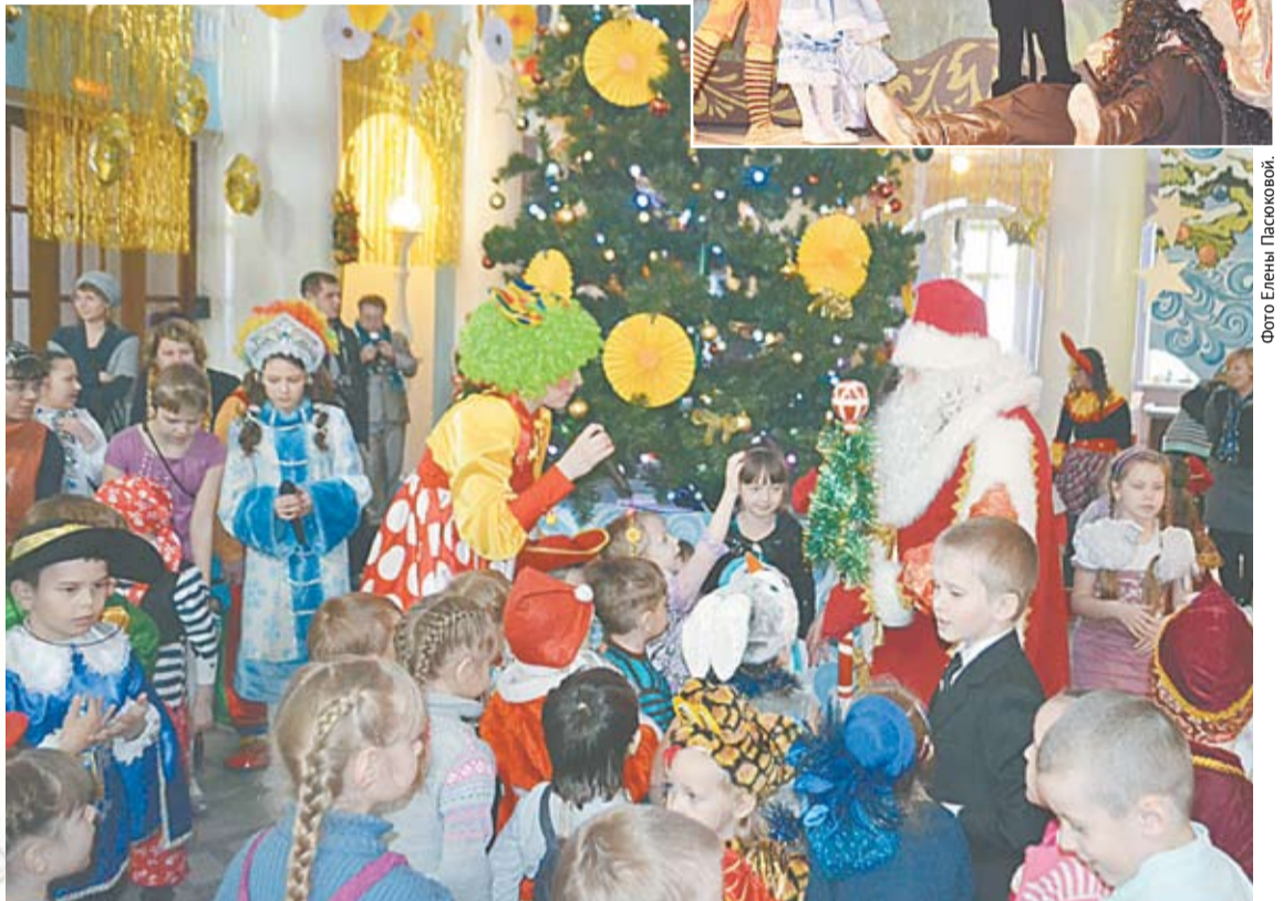
Новогоднее представление собрало много юных богдановичцев, желающих не только побывать на спектакле, но и встретиться с Дедом Морозом и Снегурочкой и получить от них подарки.