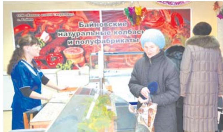
Богдановичи в буквальном смысле атаковали прилавки открывшегося магазина СПК «Колхоз имени Свердлова».

На прилавках магазина покупатели ждали охлажденное и мороженое мясо, 10 сортов колбасы и около двадцати – мясopодуктов (в их числе и вкусные пельмени «Холмогорские», не только не