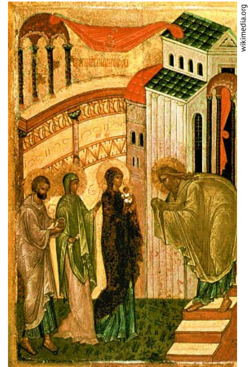
Сретение Господне (новгородская икона конца XV века).