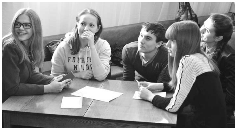
Команда юных знатоков истории школы № 2 одержала победу в «морском бою» с командой Ильинской школы.