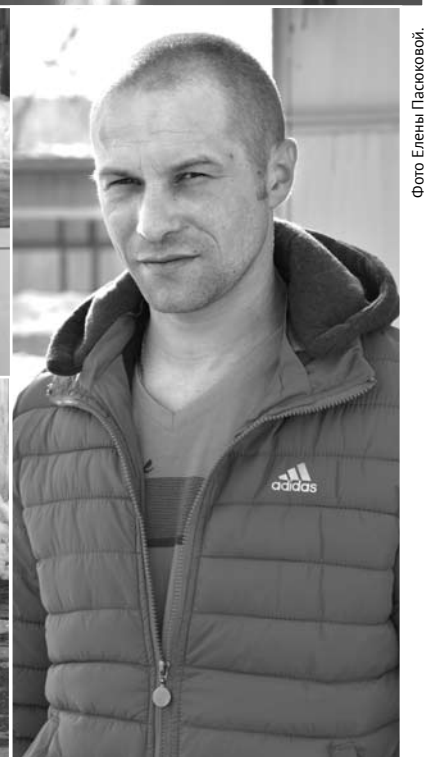
Люди на Тыгшской территории живут по-разному, но большинство из них к жизни относится с оптимизмом.