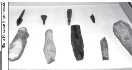
Посуда, найденная при раскопках Кашинского городища (экспонаты музея Коменского ДК, снимок слева), и наконечники стрел и копий (экспонаты краеведческого музея).