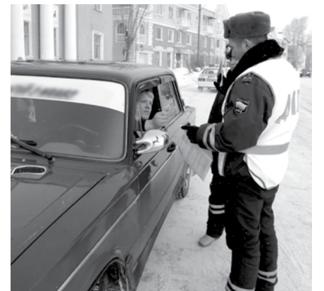
В ходе мероприятия с водителями проводятся профилактические беседы.

В образовательных учреждениях городского округа Богданович для детей проходят занятия, беседы, викторины, конкурсы и другое. Сотрудники ГИБДД обследуют улично-дорожную сеть вблизи каждого детского образовательного учреждения, а также в зонах организованного досуга детей и подростков (парки, Дома культуры, торговые центры).