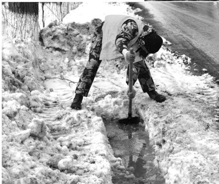
Сезонное подтопление города происходит ежегодно, но коммунальные службы по мере сил борются с этим явлением.