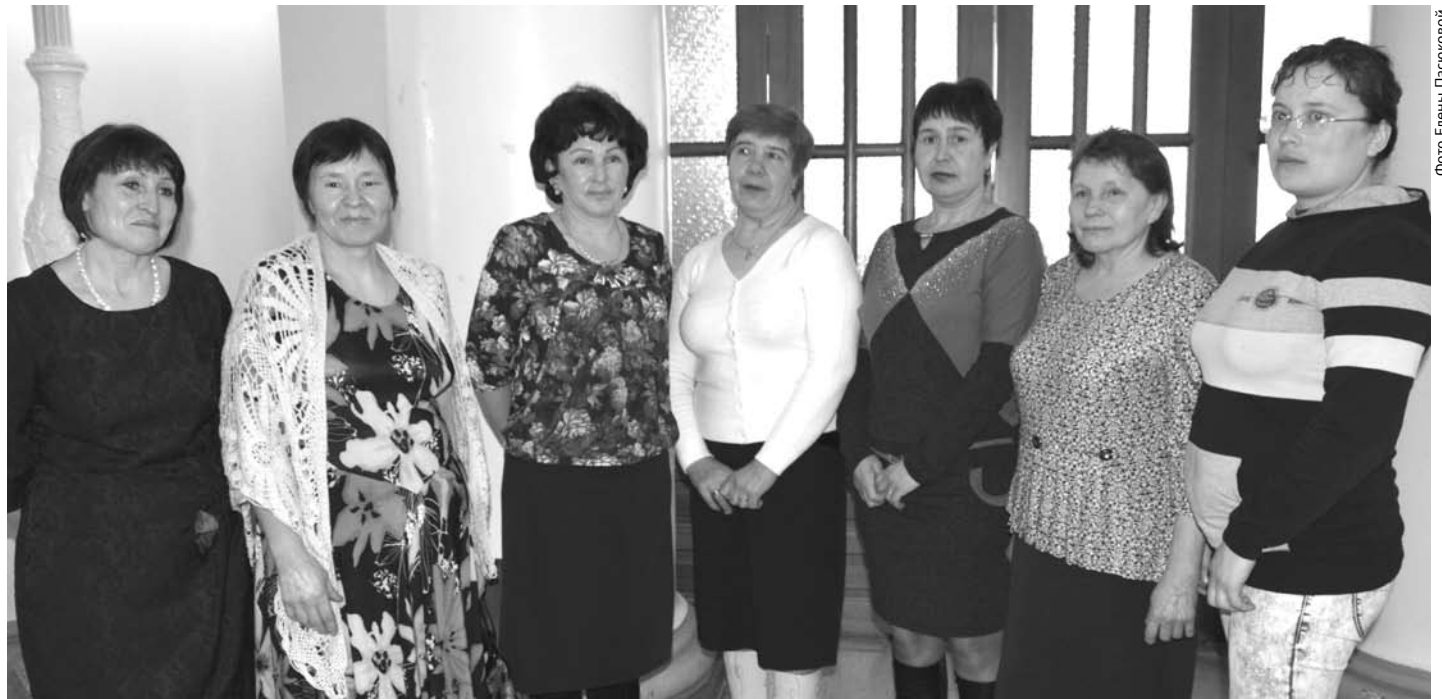
На торжественном собрании встретились лучшие доярки ООО «БМК» и СПК «Колхоз имени Свердлова».