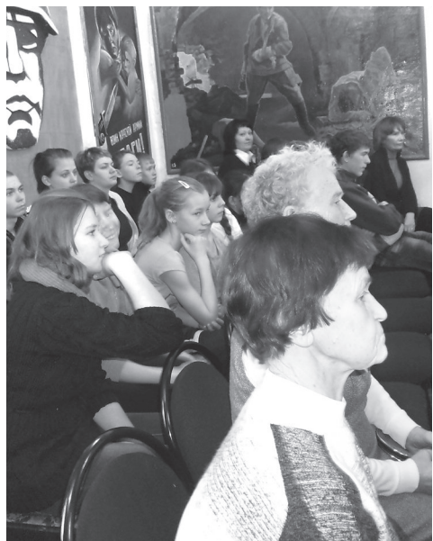
Ребята из отряда «Память» рассказали о том, как проходили поиски без вести пропавших солдат в боях под Москвой. Они показали фильм и найденные на местах боев предметы: снаряды, гильзы и медальоны.

УРАЛЬСКИЕ поисковики разыскивают без вести пропавших солдат.