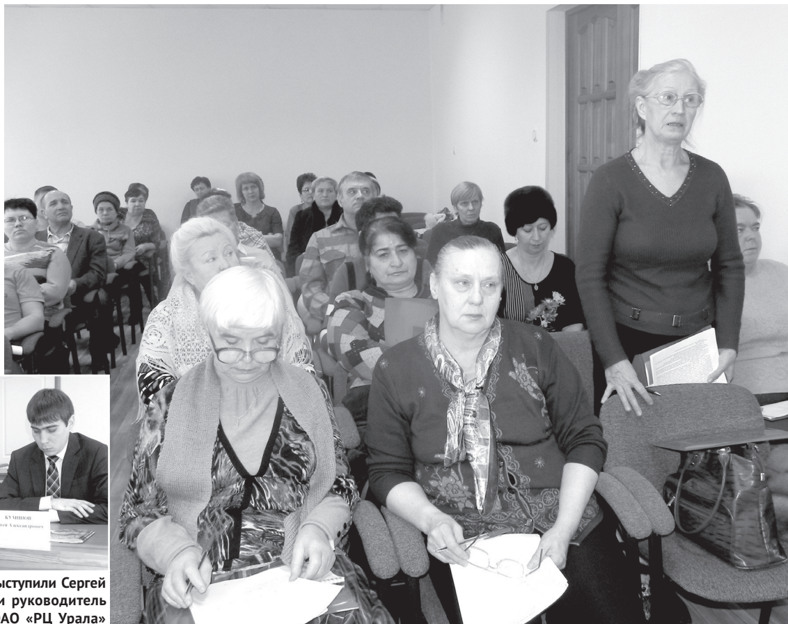
Председатели Советов МКД обсудили с докладчиками ряд важных вопросов.