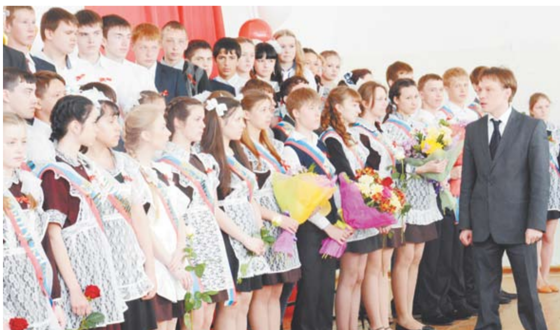
На последнем звонке главные герои праздника – выпускники – выступали со словами признательности педагогам, родителям, принимали поздравления и выслушивали наказы, один из которых дал глава ГО Богданович Владимир Москвин.