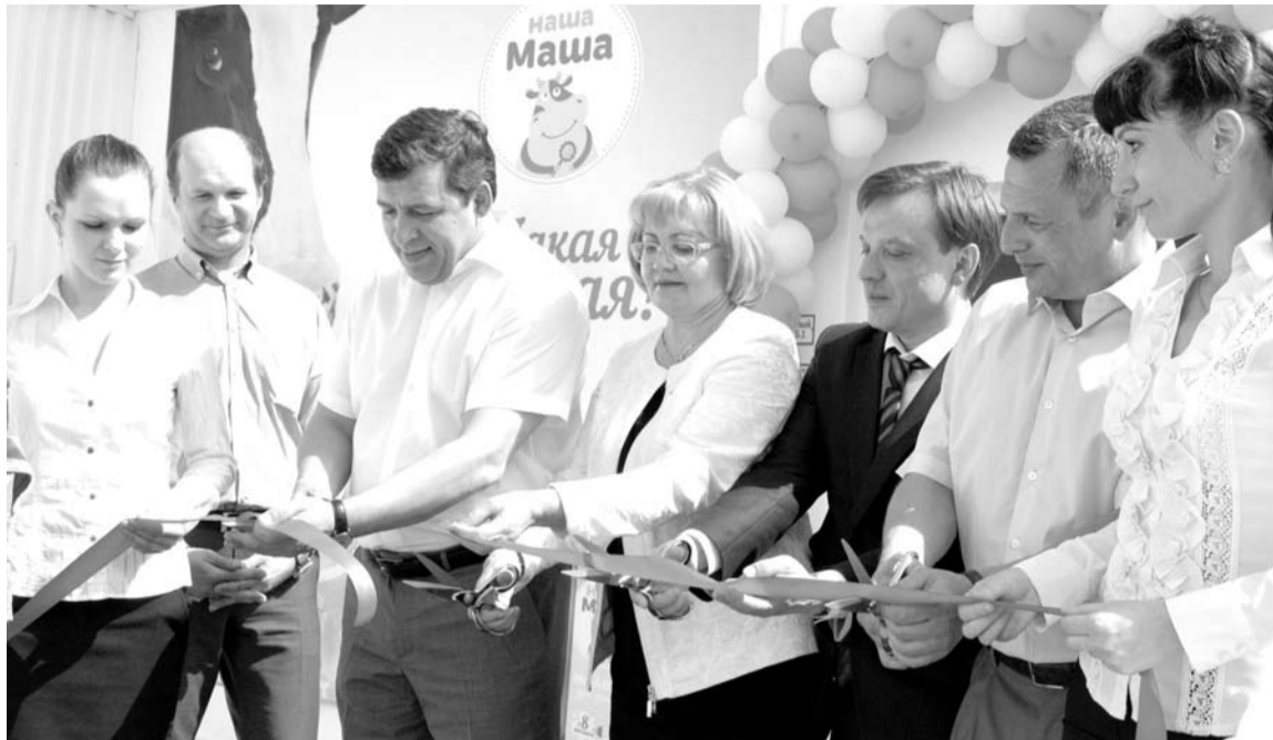
Торжественное открытие нового цеха молочного завода.