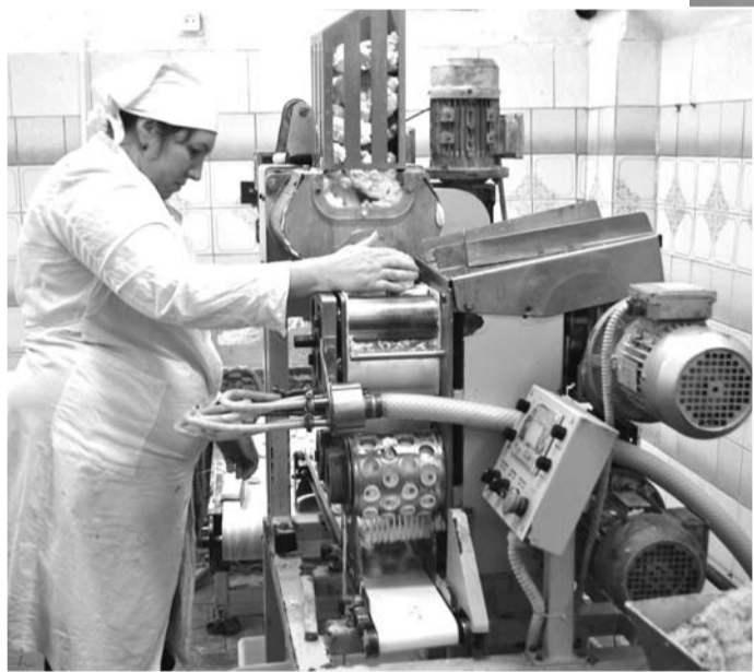
Руководством Богдановичского мясокомбината принято решение приостановить деятельность в связи с модернизацией предприятия. Ориентировочно срок пуска нового производства – февраль 2015 года.