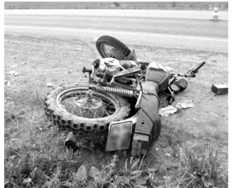
Разбитый мотоцикл - итог нарушения Правил дорожного движения.

Надо отметить, что оба этих экстремала ранее уже