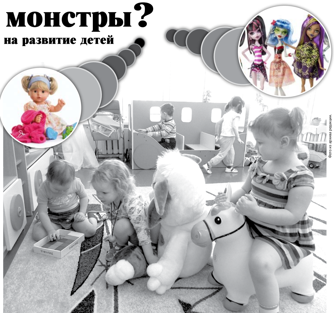
Дети познают окружающий мир с помощью игрушек. Поэтому важно, чтобы ребенка окружали реалистичные добрые и красивые игрушки.

В ближайшем от моего дома детском Окончание на 4-й стр.