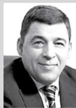
подводили Урал и уральцев на протяжении веков.

Губернатор Свердловской области Евгений Куйвашев: