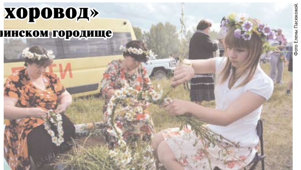
Цветок ромашки – символ семьи, любви и верности. Многие из присутствовавших сплели венки из ромашек не только себе, но и другим гостям праздника.