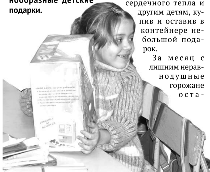
Ребенок рад любому подарку.

че добродушных Жирафа и Льва вручили подарки юным школярам, чему сами виновники благотворительной акции сильно обрадовались. А организаторы от всей души особо поблагодарили за доброе дело магазины «Империю игрушек», «Непоседа», «Карпуз», «Все для праздника», бутик детских игрушек в ТЦ «Партизан».