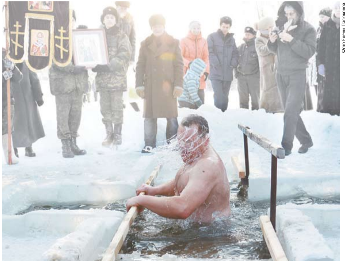
Ох, и хороша Крещенская водица! Студеная, обжигает, все грехи и болезни смывает.