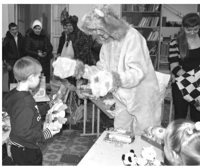
Лев из «АТОМа» пришел к детям школы № 1 не только с подарками, но и хорошим настроением.

За месяц с лишним неравнодушные горожане оставили