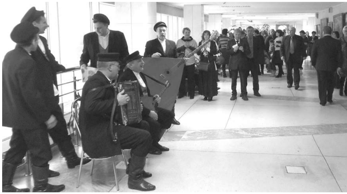
Фото пресс-службы администрации ГО Богданович.

Пресс-служба администрации ГО Богданович.