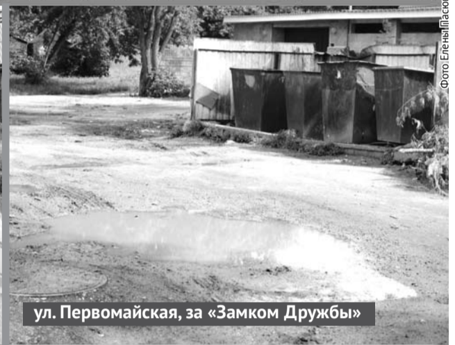
ул. Первомайская, за «Замком Дружбы»

Окончание. Нач. на 1-й стр. ГО Богданович заключила контракт на выполнение работ по частичному ремонту проезжей части улиц Крылова, Труда и Первомайской . Общая площадь выполнения ремонта асфальтового покрытия составляет 740 квадратных метров. Окончание работ запланировано на 20 августа.