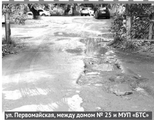
ул. Первомайская, между домом № 25 и МУП «БТС»