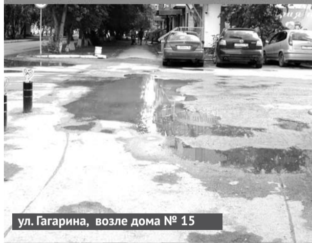
ул. Гагарина, возле дома № 15