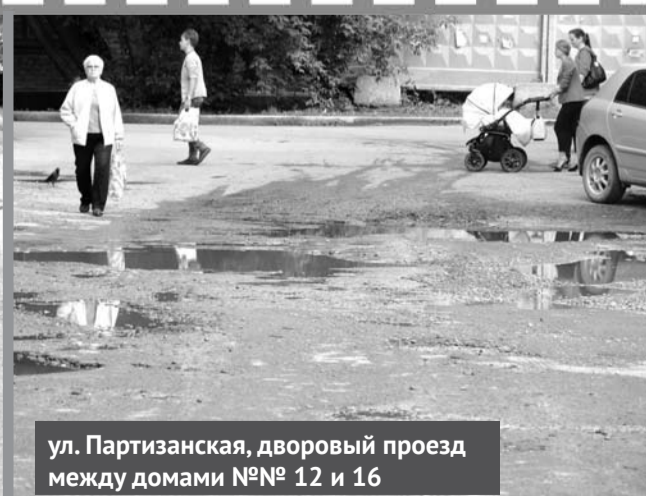
ул. Партизанская, дворовый проезд между домами №№ 12 и 16