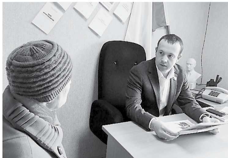
Приём граждан в Богдановиче

прерывный диалог с населением региона, и, в первую очередь, с жителями Камышлова, Пышмы, Талицы, Богдановича и Арамили.