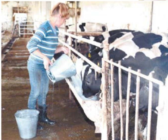
Предприятия переработки, расположенные в нашем городе, выпускают свою продукцию из местного сырья.