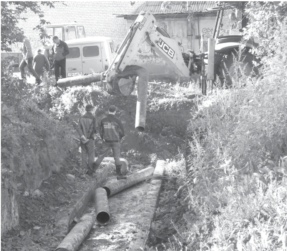
Работники МУП «БТС» ведут демонтаж старых труб на участке у перекрестка улиц Гагарина и Партизанской.

- Для нашего предприятия наиболее важным мероприятием была проверка и ремонт в котельных приборов коммерческого учёта потребляемых нами ресурсов: воды, электроэнергии, природного газа. Вместо нормативов потребления, по которым нам могли бы предъявлять оплату за ресурсы (и которые приняты со значительным «запасом»), мы будем оплачивать фактически потреблённый их объём. А для подготовки к подаче тепла в южную часть города очень важной стала замена аварийного участка магистрального трубопровода на перекрёстке улиц Гагарина и Партизанской. Благодаря этому мероприятию мы смогли заполнить сети водой и провести их исследование. Выявленные слабые места будут заменены в ближайшее время.