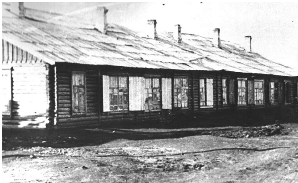
Один из бараков на улице Чкалова (1936 год).

Люди в бараках были разных национальностей, все добрые, простые. Вместе отдыхали, веселились, в общем, не унывали».