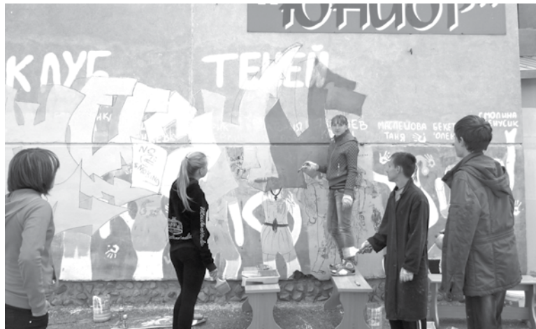
Ребята оформили фасад здания, где расположен клуб. Теперь здесь красуются яркие картинки, посвященные здоровому образу жизни.

Дворовый клуб начал свою работу в 2000 году. Инициатива создания клуба принадлежала жителям поселка Глухово, которых волновала проблема свободного времяпровождения своих детей. Первая группа подростков дворового клуба составляла всего шесть человек. В 2001 году ребят уже было 25 человек, включая группу подростков из Грязновского (11 человек).