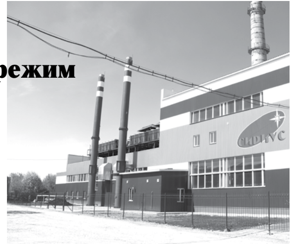
Мини-теплоэлектростанция ОАО «БГК».