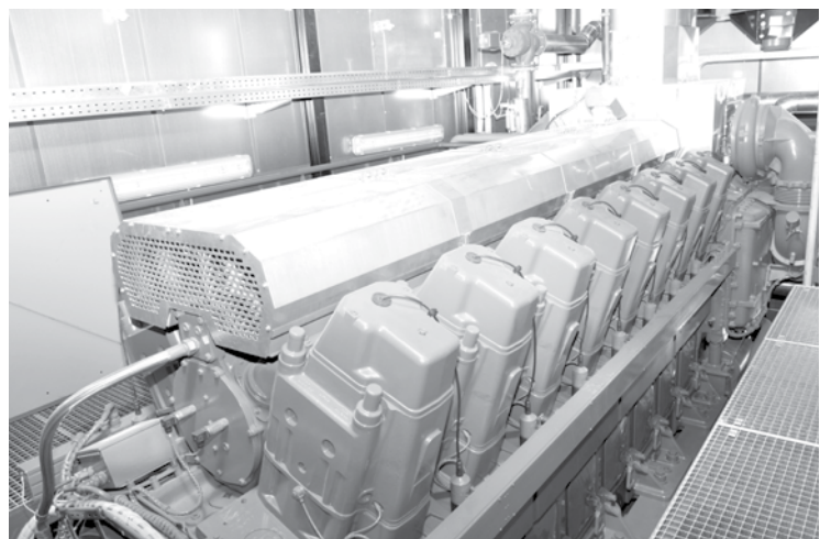
Газопоршневой генератор теплоэлектростанции ОАО «БГК».

редь, хотелось бы сказать, что за лето повысилась квалификация персонала электростанции – мы перестали бояться работающих энергомашин. Кроме того, приобрели электропушки для соблюдения теплового и влажностного режима в закрытом распределительном устройстве станции. И, наконец, нами создан «неснижаемый» запас масла для газопоршневых машин на 2,5 месяца.