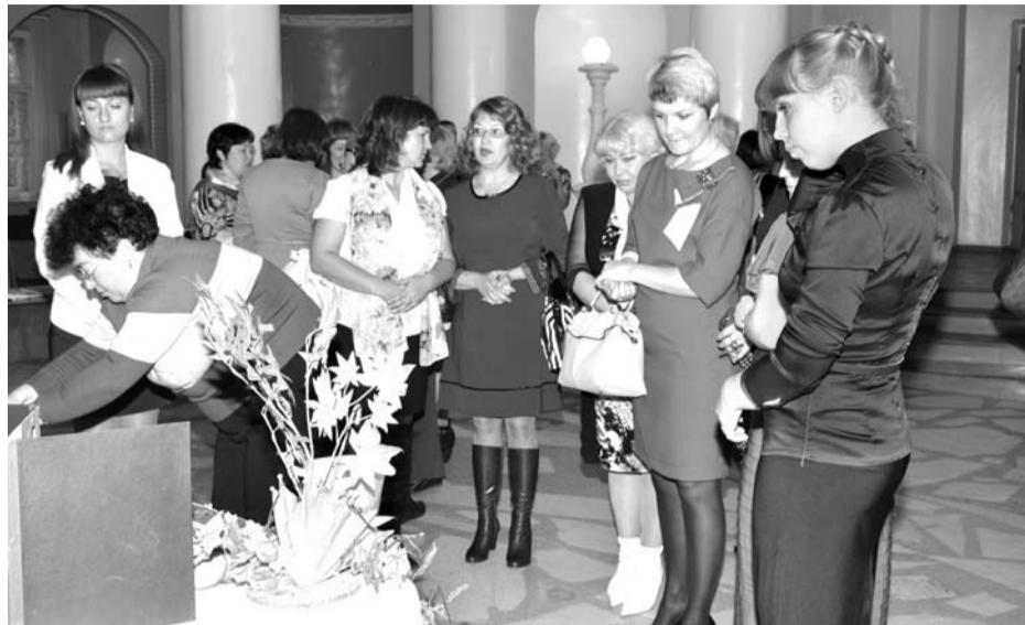
Воспитатели с интересом рассматривали представленные в фойе ДикЦ итоги работы коллег, их методические разработки и проекты.