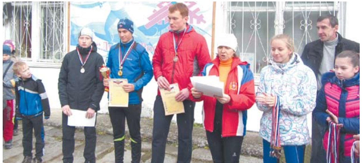
На кроссе лыжников наши спортсмены показали, что им не страшна любая трасса и они с победой дойдут до финиша.