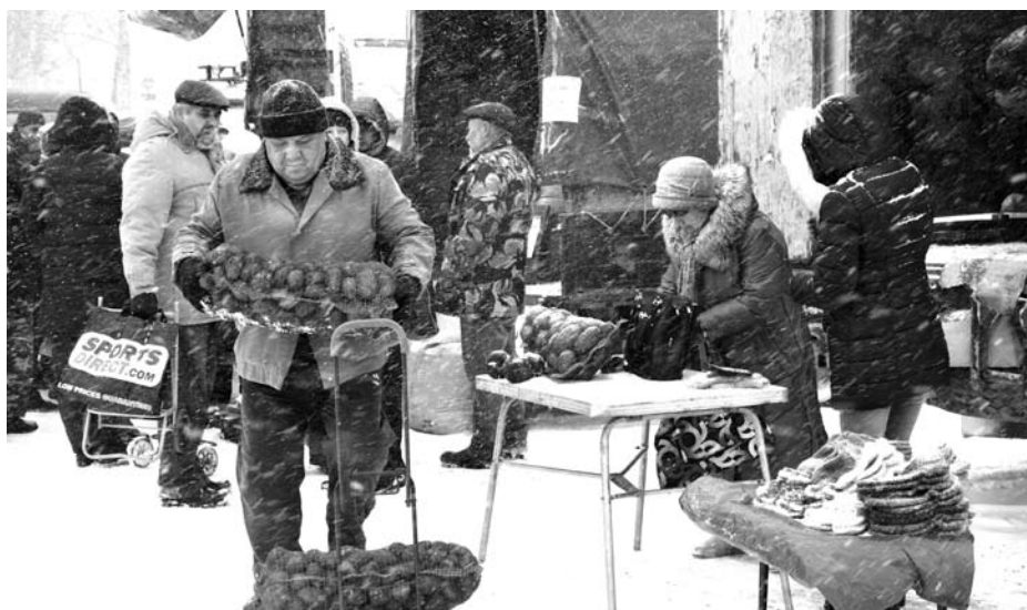
Плохая погода не остановила богдановичцев, желающих пополнить запасы на зиму.

СК «Колорит» было снежно и многолюдно. Автомобили, где торговцы представляли свою продукцию, и длинные очереди буквально заполнили площадь. Те, кто не успел пополнить запасы во время ярмарки в южной части города, делали это сейчас. Картофель, морковь и другие овощи быстро находили место в мешках покупателей. Медленно текла река, а мясо раскупалось на раз.