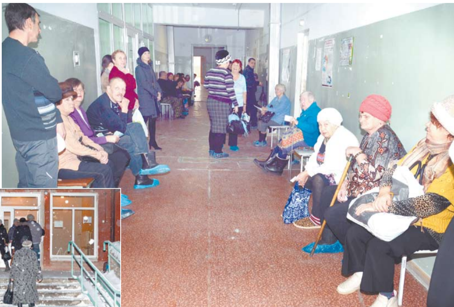
Во второй половине дня очередей в коридорах взрослой поликлиники становится меньше.