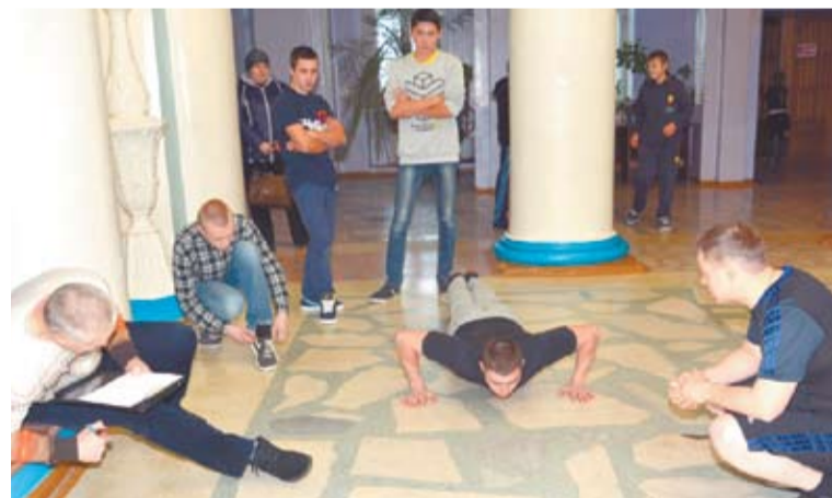
Судьи спортивного блока и друзья участников внимательно следили и подбадривали тех, кто рискнул отжиматься.

После торжественного построения открылся первый блок мероприятия – спортивный. Крики подбадривания