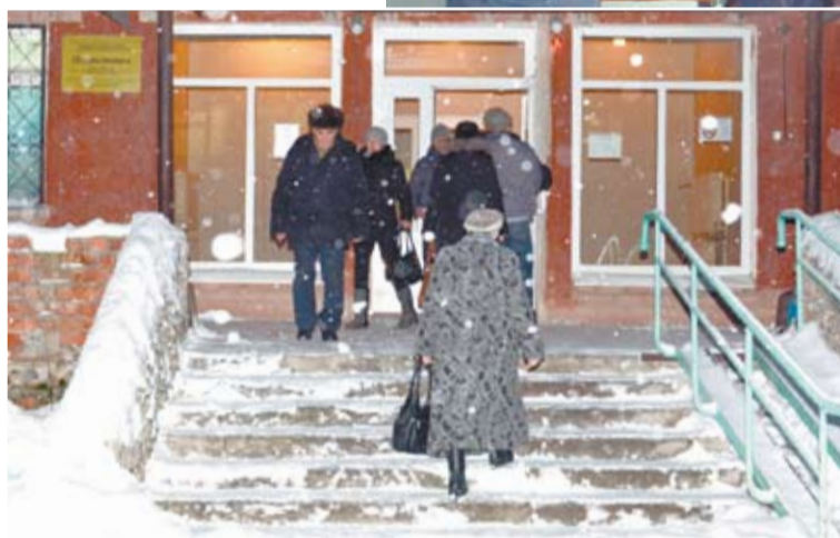
Подниматься в поликлинику по заснеженной скользкой лестнице небезопасно.