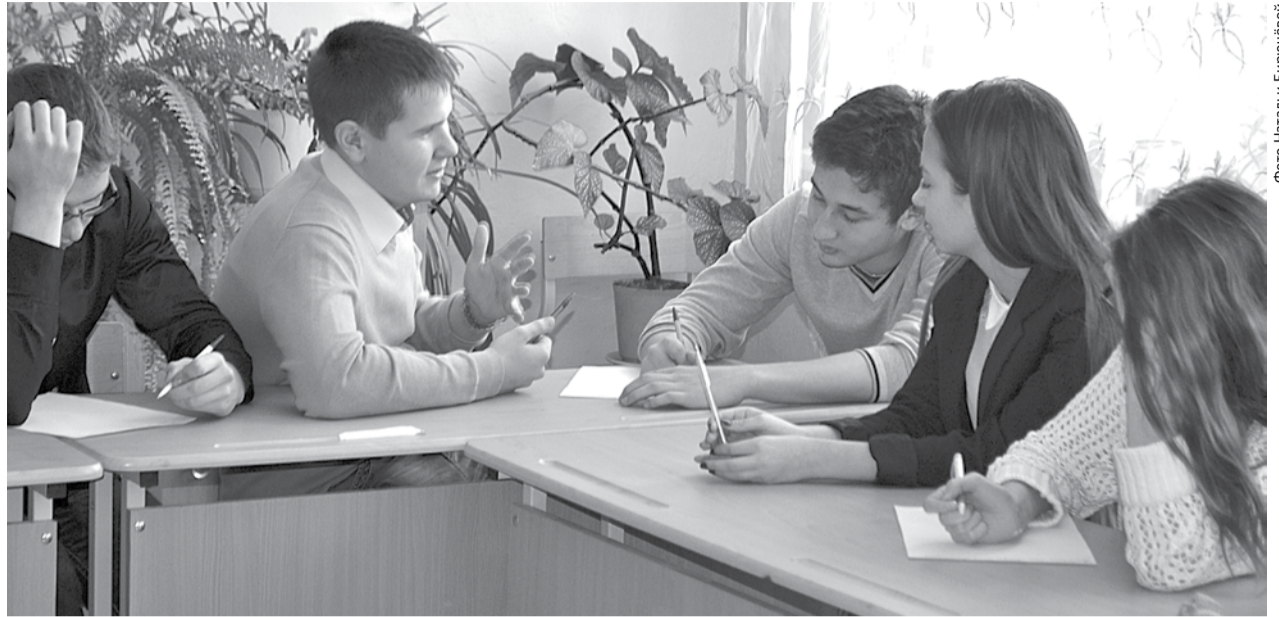
Разговор с ребятами получился конструктивным. Они охотно высказывали своё мнение, искали причины конфликтов между детьми и родителями.

В ходе беседы ребята приводили примеры из своей жизни и литературных произведений. И вот к каким выводам мы пришли в результате 45-минутного разговора.