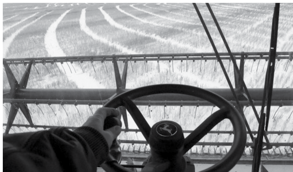
Конечно, обмолачивать зерновые по снегу – не сахар. Но не оставлять же!

поступало с повышенной влажностью и порядочно теряло вес после просушки. Богатый урожай дался нашим сельчанам ценой упорного труда и благодаря хорошей организации работ. А также потребовал солидных затрат на энергоносители, что в полях, что в зерносушильных комплексах. Наши сельчане наглядно доказали, что нет таких условий, при которых они не смогли бы собрать зерно.