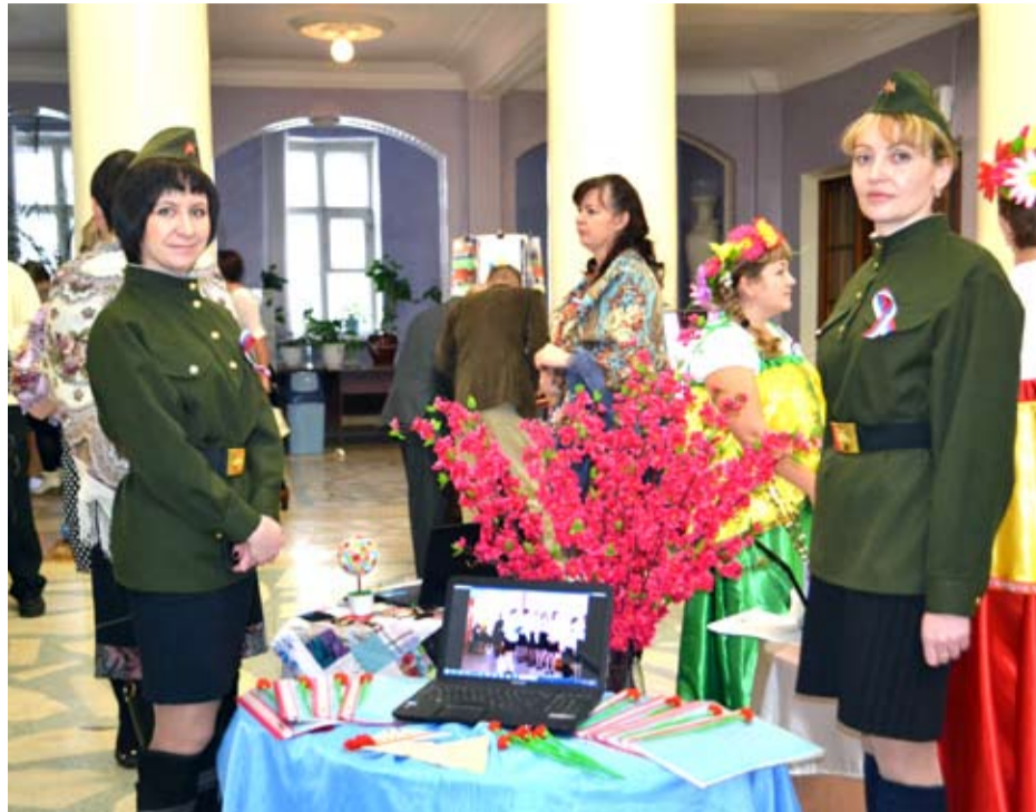
В фойе ДикЦ была организована выставка, посвящённая воспитанию патриотизма. Детский сад № 38 представил свои методические разработки.

Кандидат исторических наук, доцент кафедры истории России