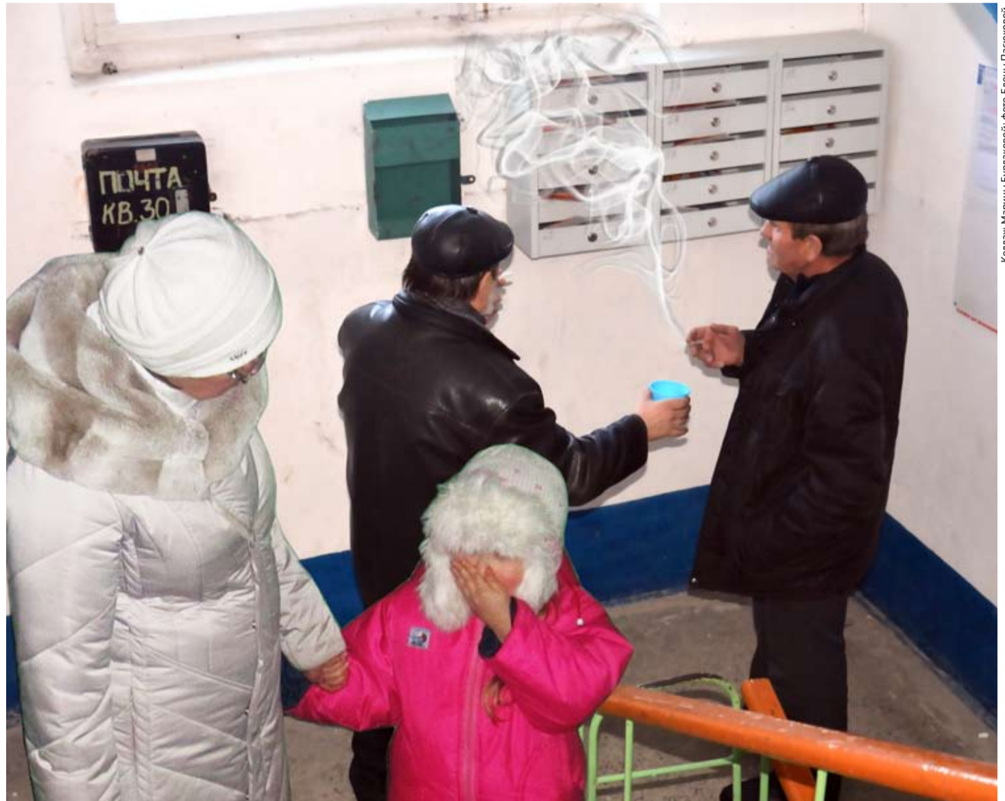
Коллаж Марины Бураковой; фото Елены Пасковой.