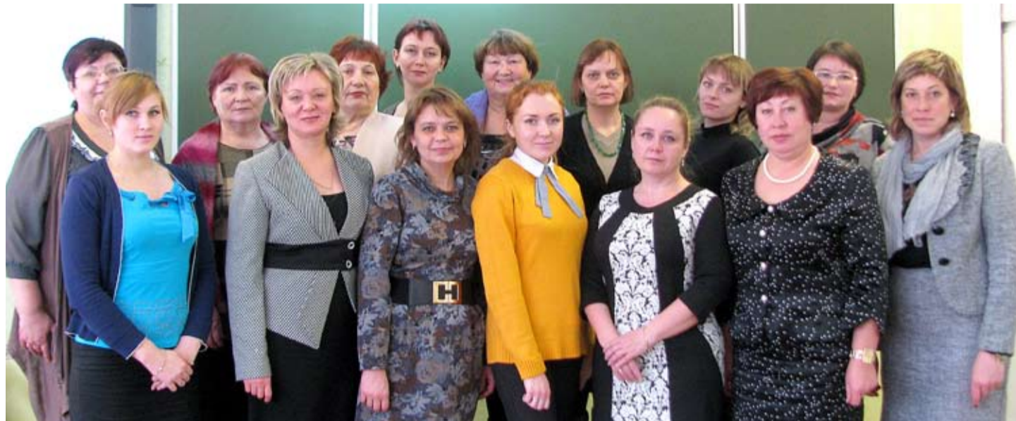
Специалисты-логопеды помогают детям правильно и красиво говорить, что очень важно для формирования личности.

Учителя-логопеды обладают такими качествами, как терпение, способность к сопереживанию, вера в ребёнка. Без этого невозможно достичь успеха в нелегком деле коррекции нарушений речи.