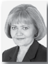
Людмила Бабушкина, председатель Законодательного Собрания Свердловской области:

«Надо максимально снять ограничения с бизнеса. На ближайшие четыре года «зафиксировать» действующие налоговые условия. Для малых предприятий, которые регистрируются впервые, будут предоставлены двухлетние «налоговые каникулы». Также льготы получат производители, начинающиеся с «нуля.»