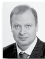
Виктор Шентий, секретарь СРО партии «Единая Россия», зампреда Засобрания Свердловской области:

вращающихся в Россию. Если человек легализует свои средства и имущество в России, он получит твёрдые правовые гарантии, что его не будут таскать по различным органам, в том числе и правоохранительным.»