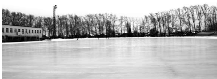
Надеемся, что через два года вид стадиона во многом изменится.