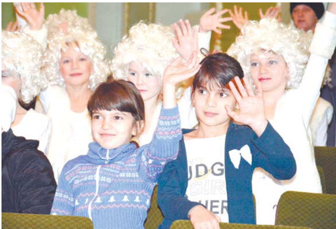
Злой мороз не помешал многим детям прийти на праздник и поиграть в веселые игры с клоунессой.

Музыка, конкурсы и игры согрели гостей праздника в этот морозный день, дети остались довольны и ушли с улыбками на лицах.