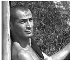
03.15 Х/ф «Фронт без флангов» (12+)