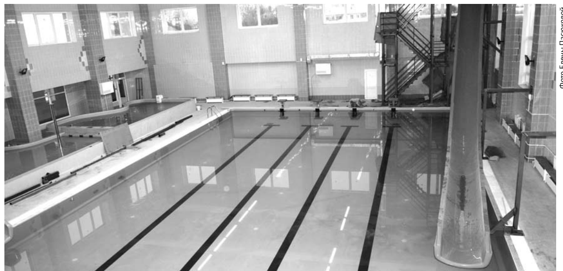
Так выглядит большой бассейн для взрослых, он заполнен водой, идет проверка на его герметичность.

Сегодня бассейн находится на стадии итоговой проверки. В конце ноября управлением государственного строительного надзора Свердловской области была проведена выезд-