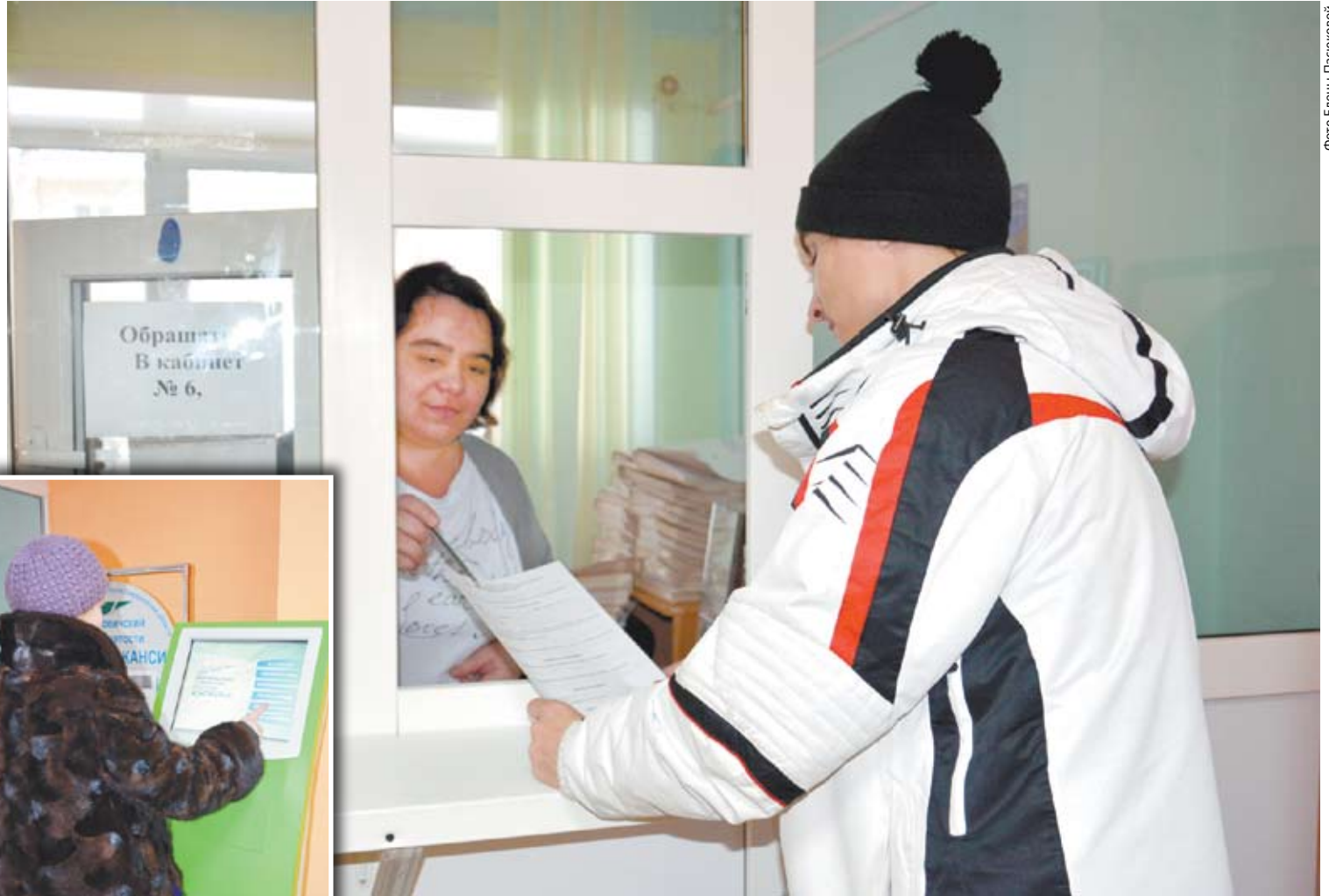
В центре занятости специалисты консультируют клиентов по всем вопросам поиска работы.