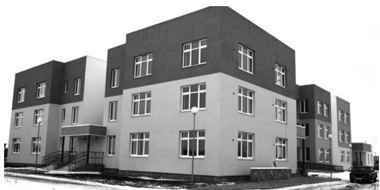
Детсад на Яблонево издали привлекает внимание яркой расцветкой.

- Штат порядка 10 человек. Инженерный персонал уже принят, он участвует в подготовке объекта к сдаче в эксплуатацию.