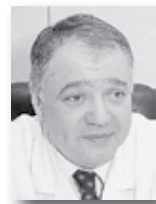
Ян Габинский, директор Уральского института кардиологии, академик:

сти. В этой связи предлагаю объявить 2015 год Национальным годом борьбы с сердечно-сосудистыми заболеваниями, которые являются основной причиной смертности сегодня.»