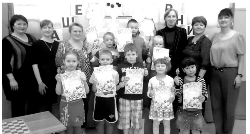
Запомните их – возможно, это будущие чемпионы нашей страны или даже мира.

Большая дорога, говорят, начинается с первого шага. Кто знает, может быть, сегодняшние победители детсадовских соревнований завтра станут чемпионами страны или мира!