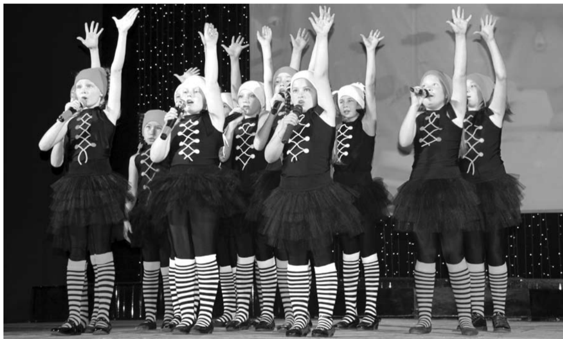
«Ассортишки», впервые участвовавшие в фестивале такого уровня, стали лауреатами III степени.