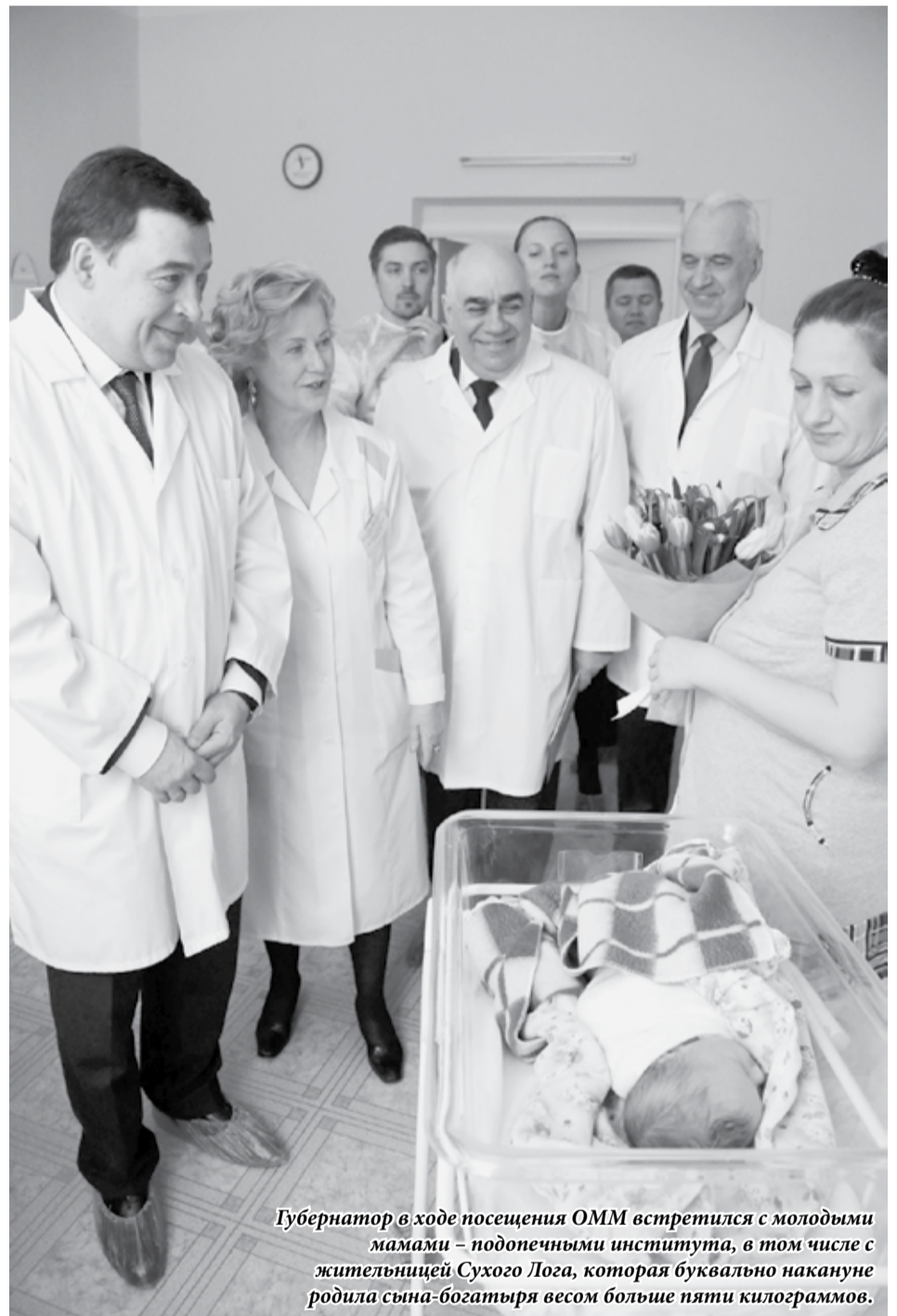
Губернатор в ходе посещения ОММ встретился с молодыми мамами – подопечными института, в том числе с жительницей Сухого Лога, которая буквально накануне родила сына-богатыря весом больше пяти килограммов.

Исправить ситуацию помогут передвижные мобильные комплексы, которые будут работать в территориях. Сейчас приобретены 5 таких автомобилей: в Первоуральске, Нижнем Тагиле, Ирбите, Каменске-Уральске и Краснотурьинске. В ближайшее время предстоит оснастить их необходимым оборудованием для оказания первичной помощи в мобильном варианте.