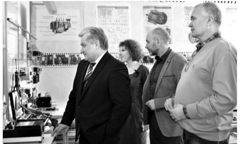
Министр остался доволен состоянием материальной базы в Богдановичском политехникуме.