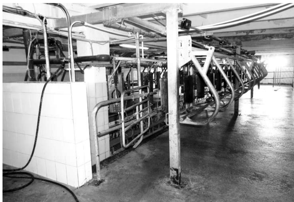
В этом зале доятся одновременно 24 коровы.

Производство молока является солидным и выгодным подспорьем хозяйству. К нынешней посевной оно готовится активно: закуплены минеральные удобрения на 3,5 тысячи гектаров ярового сева, механизаторами оно укомплектовано полностью, техника готова к выходу на поля, есть свои собственные семена зерновых и картофеля... Но вот цены на семена овощей и средства защиты растений импортного производства взлетели вдвое, растёт цена и на дизельное топливо. Поэтому на конечный продукт цены могут взлететь.