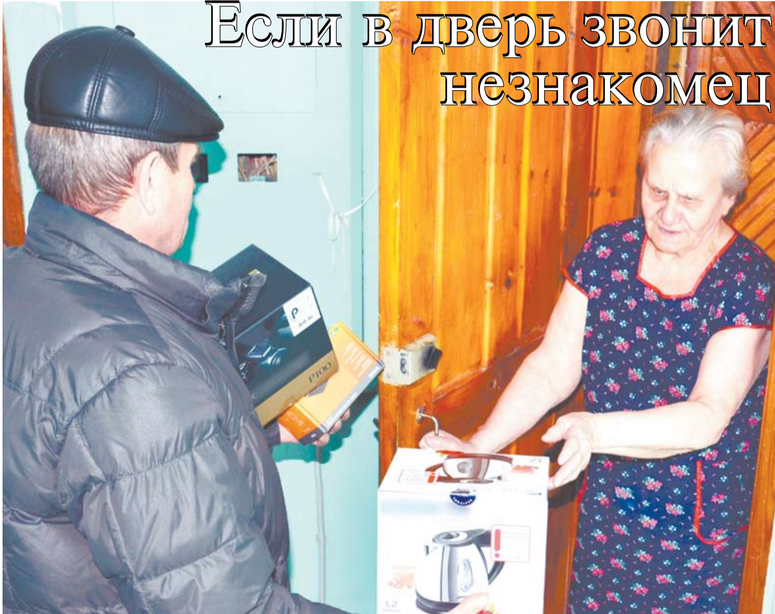
Совсем не обязательно открывать дверь незнакомым людям, чтобы приобрести бытовую технику, для этого есть магазины.