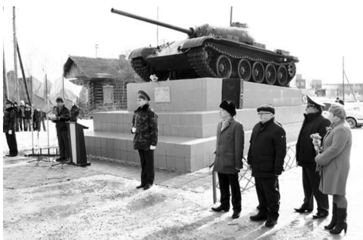
Митинг, посвященный годовщине создания Уральского добровольческого танкового корпуса, прошел в центре с. Грязновского, у танка Т-55.