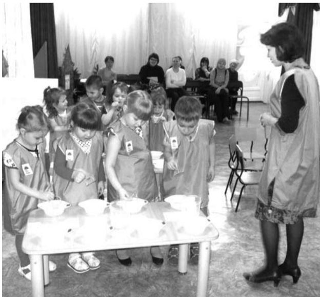
Ребятышки с увлечением готовят раствор для мыльных пузырей.