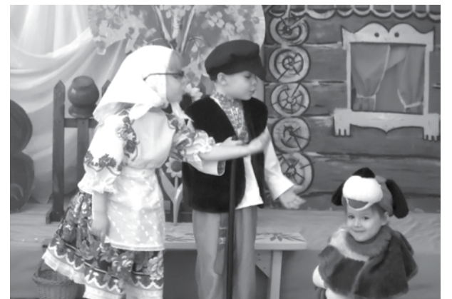
Музыкальный спектакль «Сказка про внучку и собачку Жучку» сыграли дети из детского сада № 18 и заняли первое место.

В Международный день театра (27 марта) в ДиКЦ состоялся мастер-класс режиссеров народного театра «Призма» из г. Сухого Лога и церемония награждения участников фестиваля. Первое место присудили детскому саду № 18 за музыкальный спектакль «Сказка про внучку и собачку Жучку», второе место – детскому саду № 15 за спектакль «Кошкин дом», третье место – детскому саду «Сказка» за спектакль «Апрелечка».