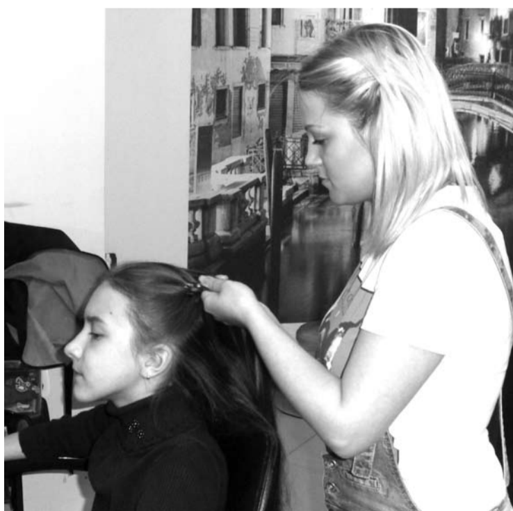
Плетение косичек, которое легко и красиво получалось у мастеров, для ребят оказалось не таким простым делом.

«Мне понравился поход в парикмахерскую. Я там научился делать две причёски. Одна причёска состоит из двух обычных кос, а вторая