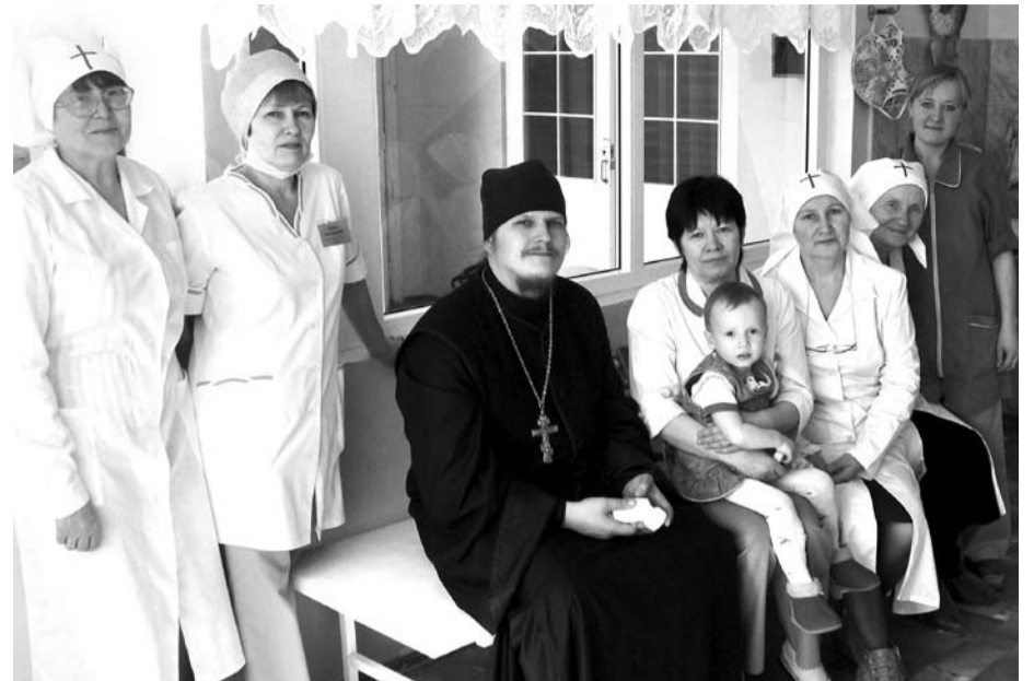
«Отдел Милосердия» при храме Иоанна Богослова оказывает помощь болящим, находящимся на лечении в Богдановичской ЦРБ.