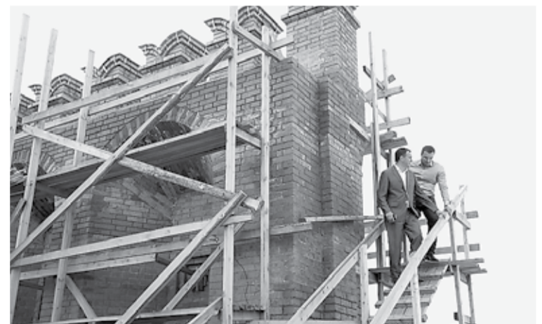
Специалисты МУГИСО контролируют процесс реставрации в Верхотурье.