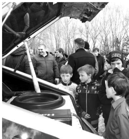
Каждый мог подойти к любой машине и посмотреть ее звуковое оснащение.

В общем и целом фестиваль удался на славу. Долго в парке звучала музыка, и народ не спешил расходиться, наслаждаясь «экстремальной» обстановкой.