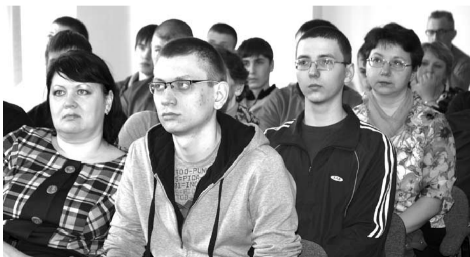
Будущие воины и их родители с большим вниманием слушали напутствия выступавших.

Желающих сказать теплые слова призывникам и их родителям было немало. Среди них депутат Думы ГО