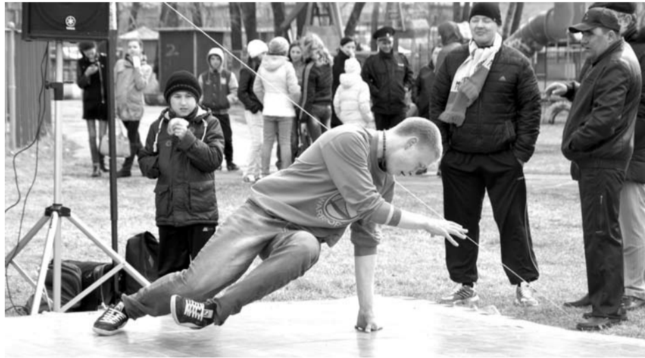
Открытие экстремального сезона в Богдановиче прошло массово и интересно.

Одними из самых зрелищных были соревнования по автозвуку. До старта каждый мог подойти к любой машине и посмотреть ее звуковое оснащение. Здесь можно было увидеть различные акустические