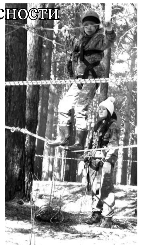
Богдановичским ребятам не страшны никакие препятствия.

Богдановичцы достойно прошли все испытания, показав умения и навыки, полученные в ходе систематических тренировок. А самое главное – это командный дух, который не покидал нашу команду на протяжении всего туристического первенства. И как следствие, у наших ребят 11 призовых мест и второе место в общекомандном зачёте. Уступили