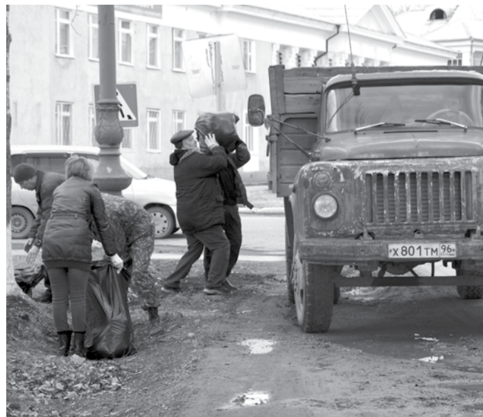
Уборкой мусора на участке улицы Ленина от Мира до Советской занялись работники ООО МУП «Уютный город».