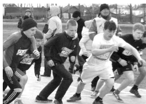
Каждый легкоатлет выложился по максимуму, преодолевая дистанцию.