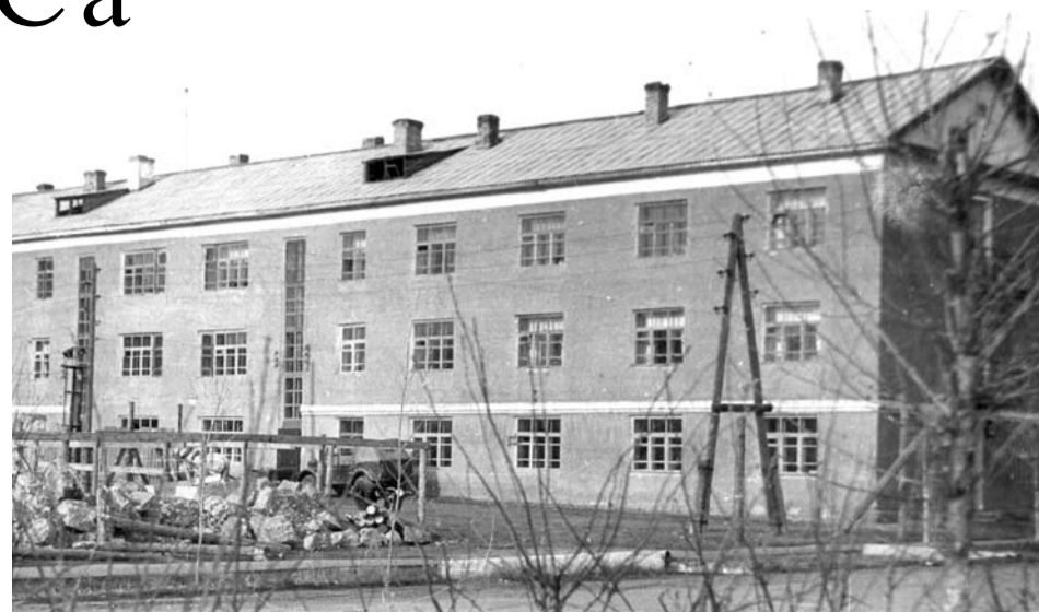
В этом здании на первом этаже находился отдел ЗАГС а в годы войны.

Так же, как и сейчас, в военные годы от уплаты государственной пошлины освобождалась регистрация актов рождения, смерти и усыновления. Если работники органов ЗАГС а совершали действие без оплаты госпошлины либо неправильно или несвоевременно её взимали, они подвергались штрафу в размере до 100 рублей.