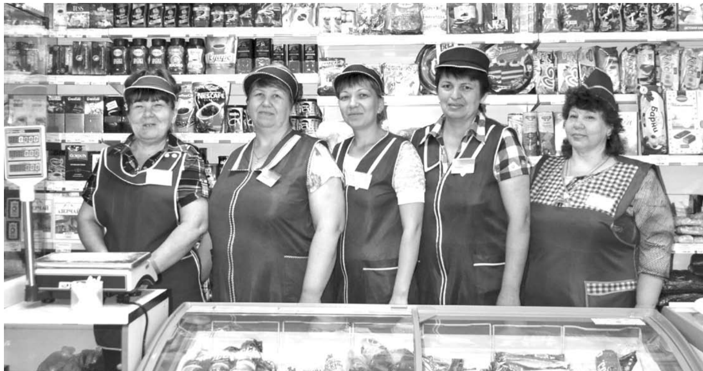
Коллектив магазина «Продукты» в с. Кунарском очень дружный и сплоченный, их объединяют любовь к профессии, ответственность и доброжелательное отношение к покупателям.