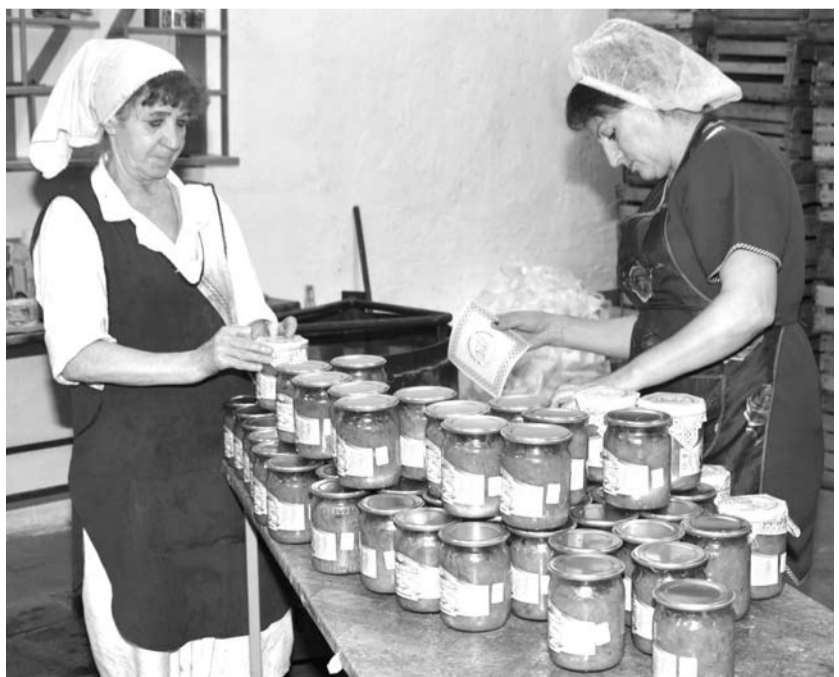
Склад пищекомбината опустошается с большой скоростью, что радует работников предприятия.

В преддверии нового урожая огурцов коллектив пищекомбината подготовил оборудование и произвёл косметический ремонт производственных помещений. И ждёт поступления сырья.