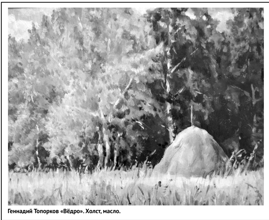
Геннадий Топорков «Ведро». Холст, масло.

Читаю, смотрю, дышу красотой и чистотой слова, глубиной мысли. Как всего этого не хватает в нашей жизни! Как это вовремя...»