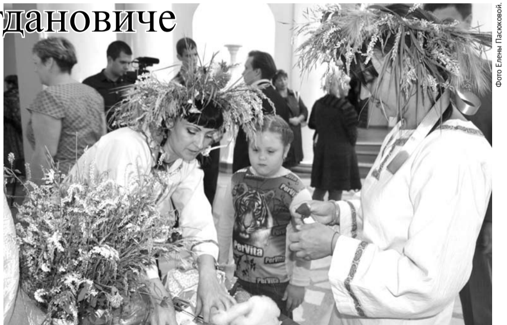
На фестивале проходили различные мастер-классы, в том числе и по плетению кукол.

Участники фестиваля выступали в номинациях «Кадриль», «Частушка», «Народные игры» и других. На сцене происходило нечто невероятное: зажигательная кадриль сменялась озорными частушками, те, в свою очередь, уступали место народным играм. Артисты показали, что русские народные гуляния с песнями и плясками не могут никого оставить равнодушным.