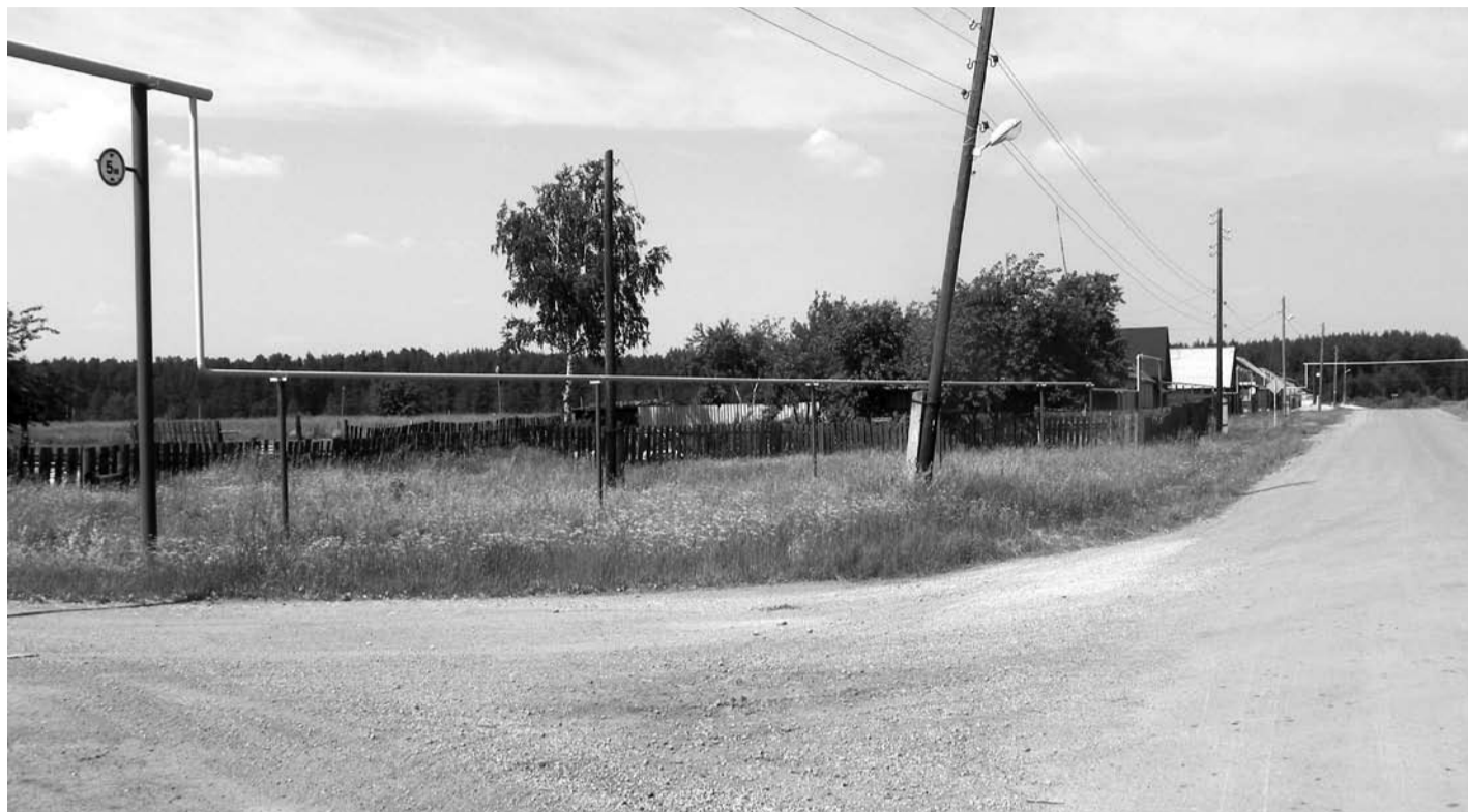
Газопровод, построенный на ул. Мира в селе Кунарском.

- Для этого необходимо иметь свидетельство права собственности на земельный участок, составить проект газопровода, определить подрядчика, который и произведёт строительно-монтажные работы. С выходом в свет постановления правительства Российской Федерации №1314 от 30 декабря 2013 года, порядок подключения к газовым сетям поменялся. Согласно этому постановлению, человек с правом собственности на земельный участок